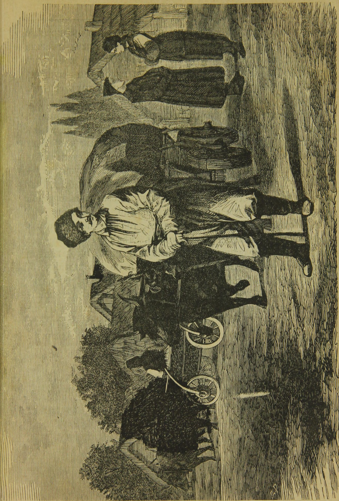
МАЛОРОССІЯ ВОРОНЕЖСКОЙ ГУБЕРНІИ.