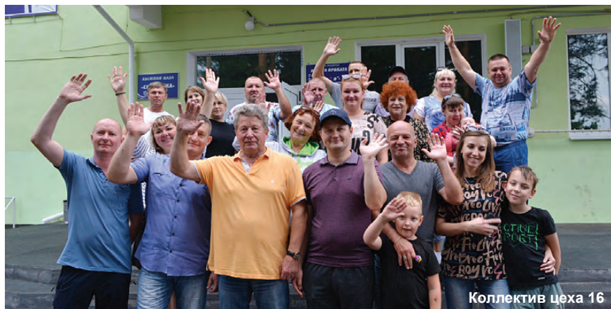
Коллектив цеха 16