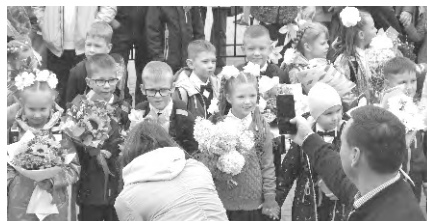
Центров детских инициатив. И вводятся ставки советников по воспитательной работе, - отметил Соловьёв.

С 1 сентября программа воспитательная станет обязательной составной частью всего образовательного процесса. Чтобы активизировать воспитательную работу в школах, идёт работа по созданию