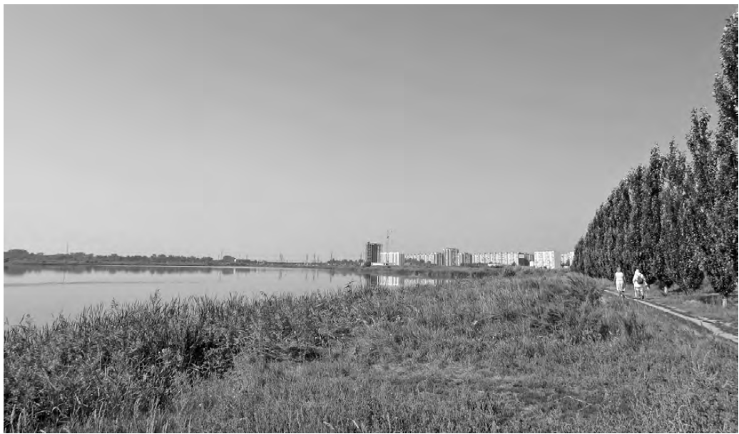
Пока даже не верится, что совсем скоро на заболоченном берегу озера Черного вырастет новый микрорайон.

В Курганской области создан банк земельных участков, в который включено 1187 гектаров свободной земли. До 2030 года под КРТ отдадут 259,4 гектара, где планируется построить минимум 600 тысяч квадратных метров жилья и 50 тысяч квадратов коммерческих объектов.