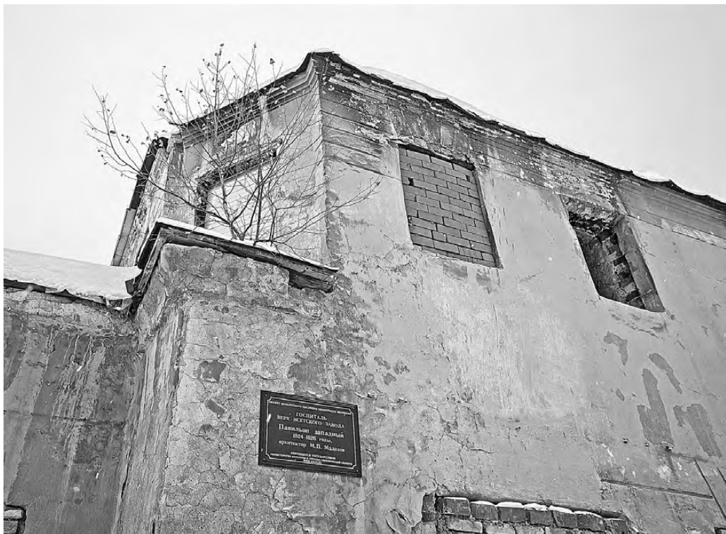
В 2016 году, до реконструкции, бывший госпиталь Верх-Исетского завода в Екатеринбурге был на грани полного разрушения.