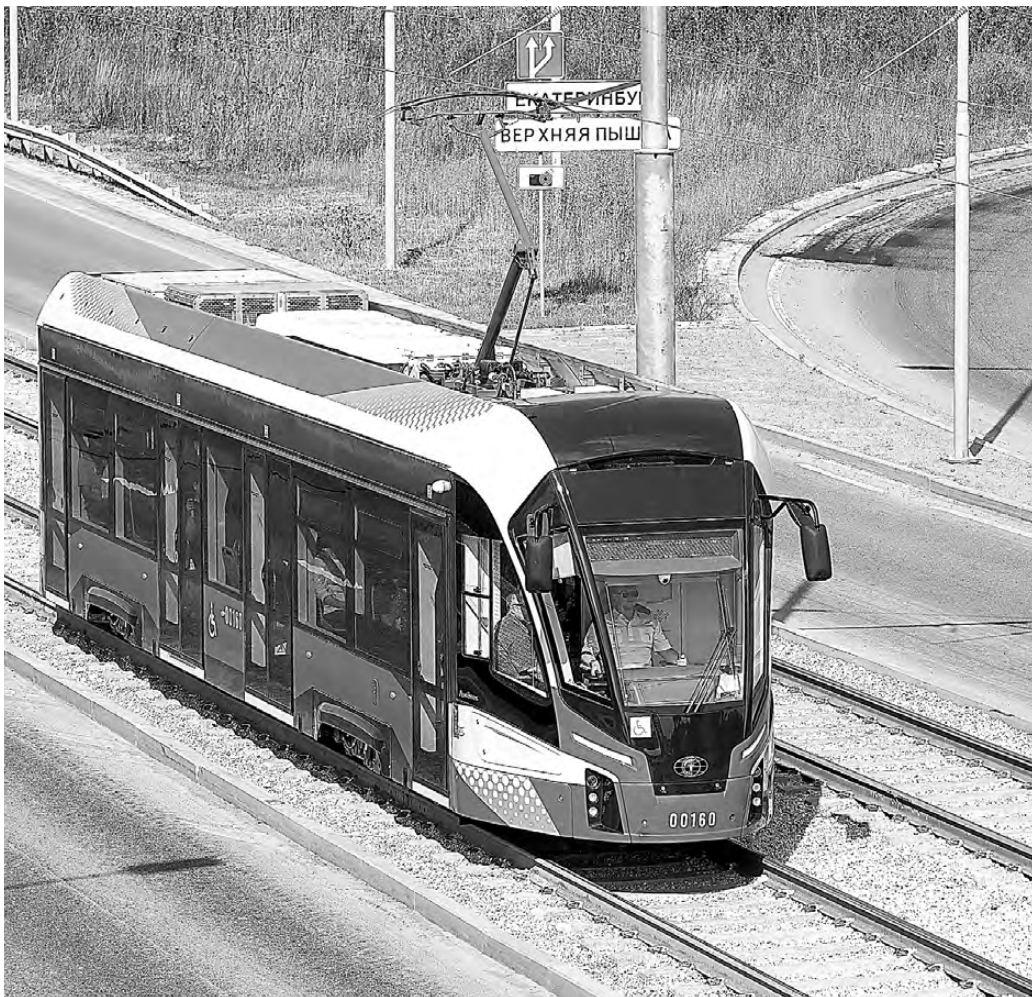
333-й уже активно курсирует между городами.