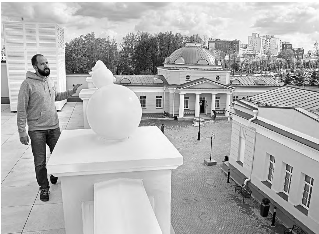
Сегодня в отреставрированном историческом ансамбле располагается современный и весьма востребованный культурно-выставочный центр.