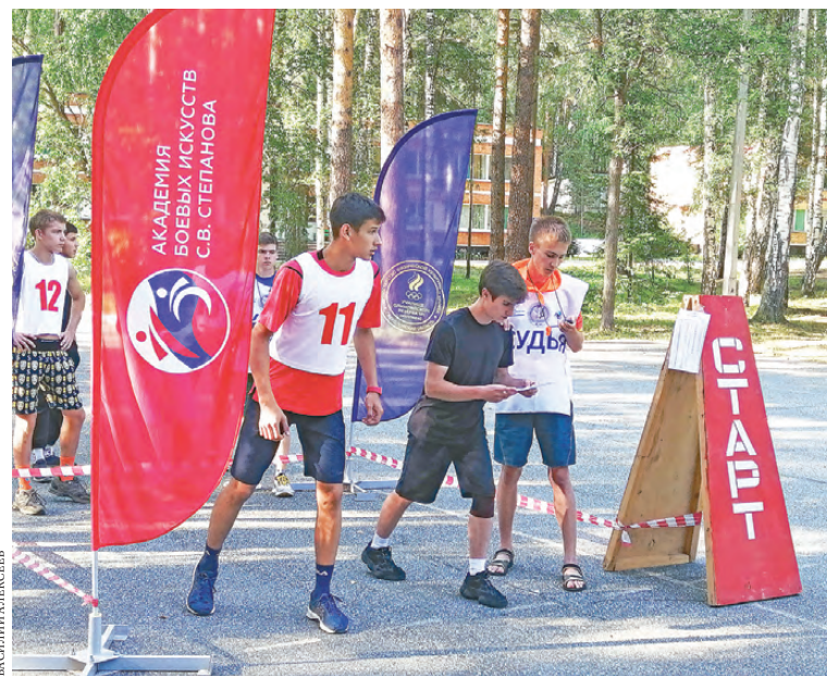
Команда «марш» — и спортсмены отправляются по маршруту.

В тот день я общался со многими юношами и девушками, и в жизни каждого был мрачный эпизод: родители забрали на фронт, член семьи погиб от мины, абсолютно у всех — обстрелы и бомбежки. Приехав на Урал, ребята окунулись в атмосферу беззаботного детства: веселились, на время забыв, что такое бояться за свою жизнь, налаживали отношения со сверстниками. Остается надеяться, что и в разрушенные республики придет мир и их жители смогут дружить и любить.