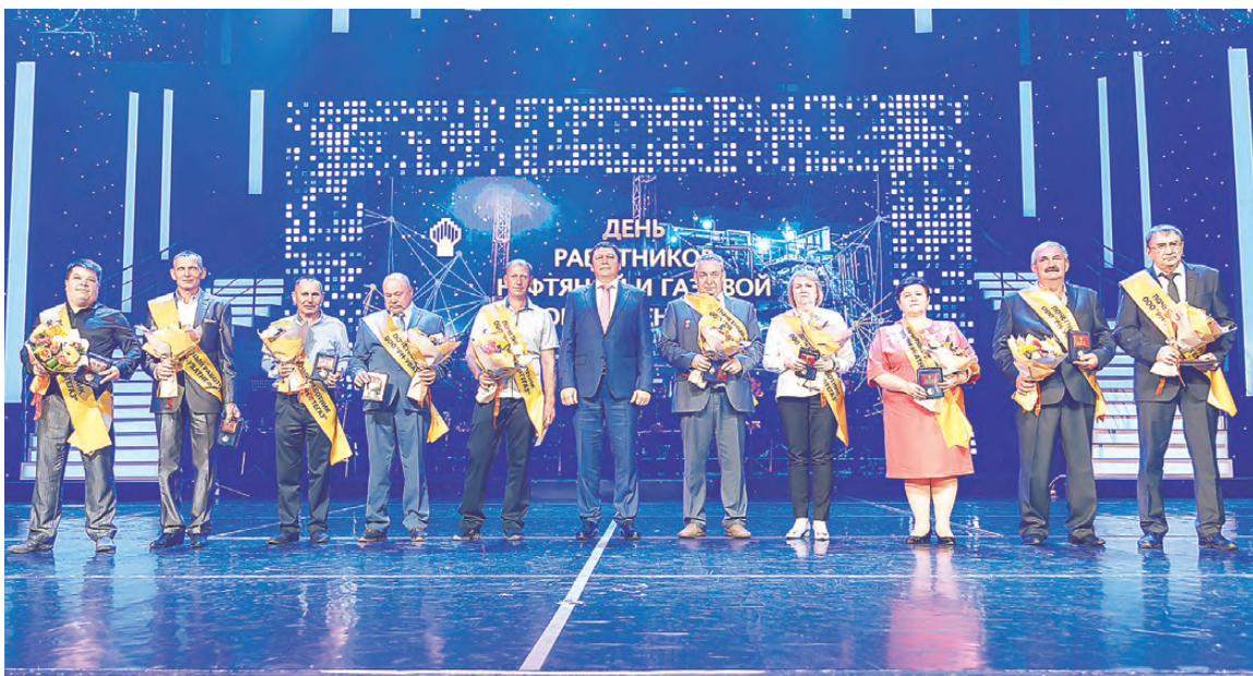
Впервые десять лучших сотрудников «РН-Уватнефтегаза» отметили новым знаком отличия — «Почетный работник».