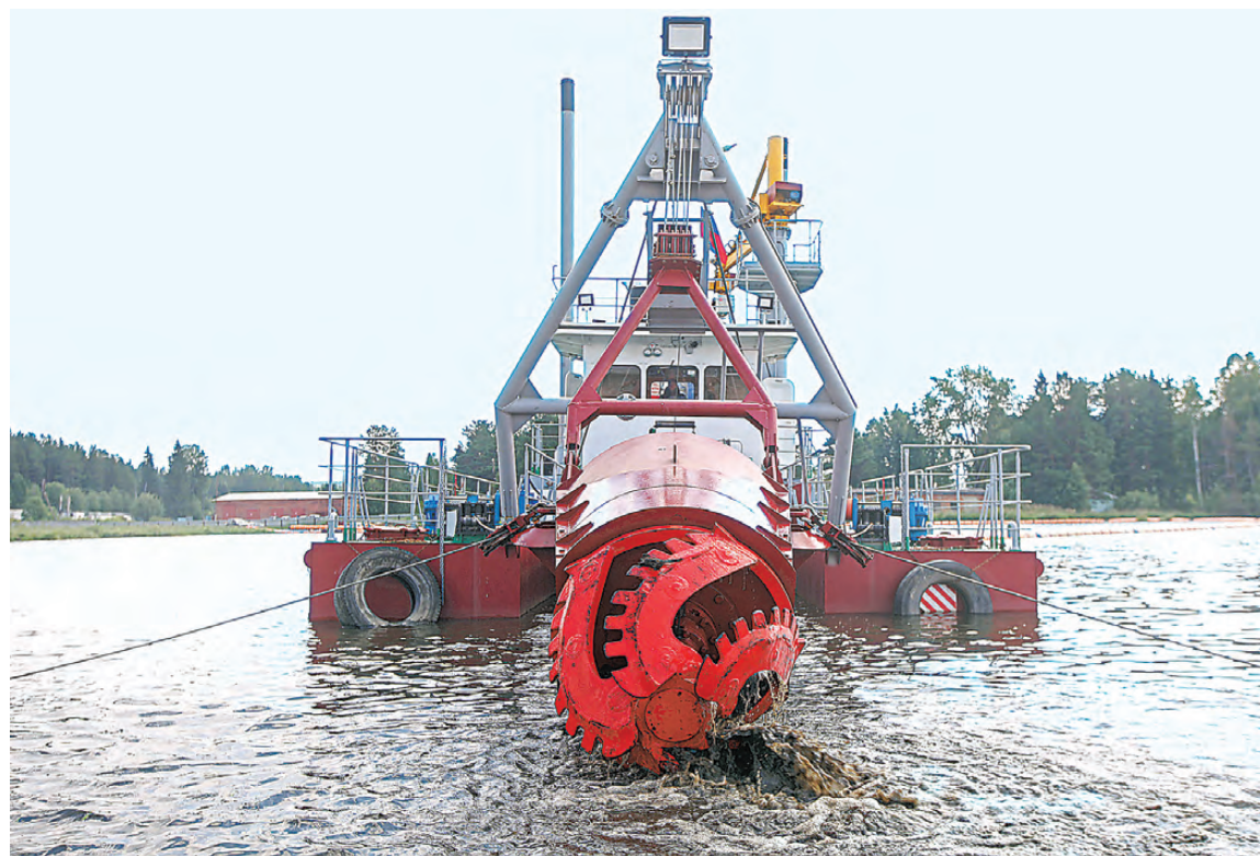
Подвижная фреза в носовой части земснаряда засасывает залежи ила, коряг и прочего мусора.

Новенький земснаряд до сих пор поблескивает на солнце крепежами и деталями. Внешне выглядит как корабль: есть и рубка капитана, и трюм, и даже мачта с российским стягом и флагом Нижнего Тагила, но по сути это мобильный плавающий пылесос. В носовой части