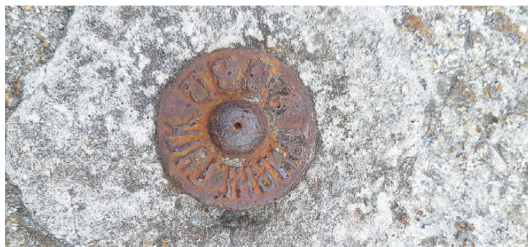
Некоторые геодезические пункты почти незаметны.