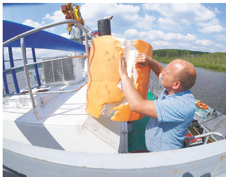
Под покровом ночи бобры перегрызли одну из ячеек наружного слоя трубы.

Земснаряд больше всех встревожил и заинтересовал бобров—старожилых здешних берегов. Зверьки решили испытать систему на прочность. Для большей плавучести в оболочку из пенопропилена обернута опущенная в воду гибкая пластиковая труба пульпопровода. От волн она извивается на поверхности водоема, как огромный змея бело-желтого цвета. Ночью, когда работы останавливаются и волны