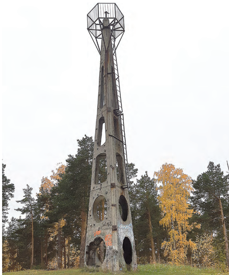
Такой пункт ГГС видно издалека.