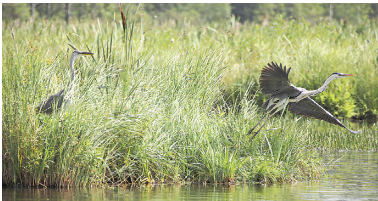
При приближении катера цапли перелетают подальше от воды, чтобы вскоре опять вернуться в пункт наблюдения.

На сохранность уникального ландшафта очистка Черноисточинского пруда повлиять не должна. По утверждению разработчиков, его состояние только улучшится: в речку Черную и Ушковскую канаву вернется очищенная вода, поднятая со дна водоема и перебранная по трубе на площадку для фильтрации. А ил после отстаивания в герметичных мешках отправится в виде удобрения на газоны Нижнего Тагила.