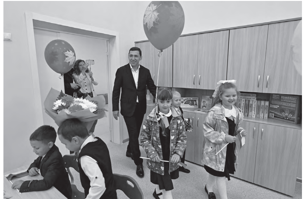
Евгений Куйвашев во время посещения школы в г. Березовском

Программа «Кампус», помимо современной инфраструктуры для учебы, позволит сформировать и другие стимулы, чтобы молодежь хотела учиться на Среднем Урале. В их числе – новая