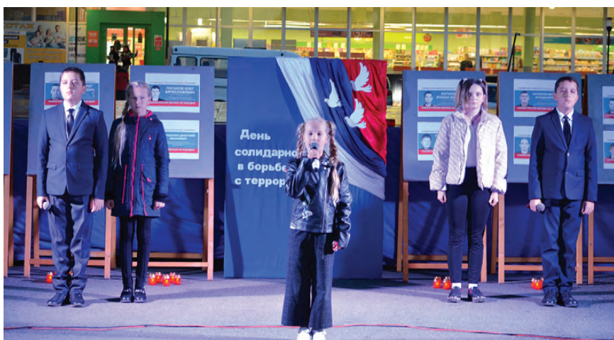
Участники акции почтили светлую память жертв террористических актов