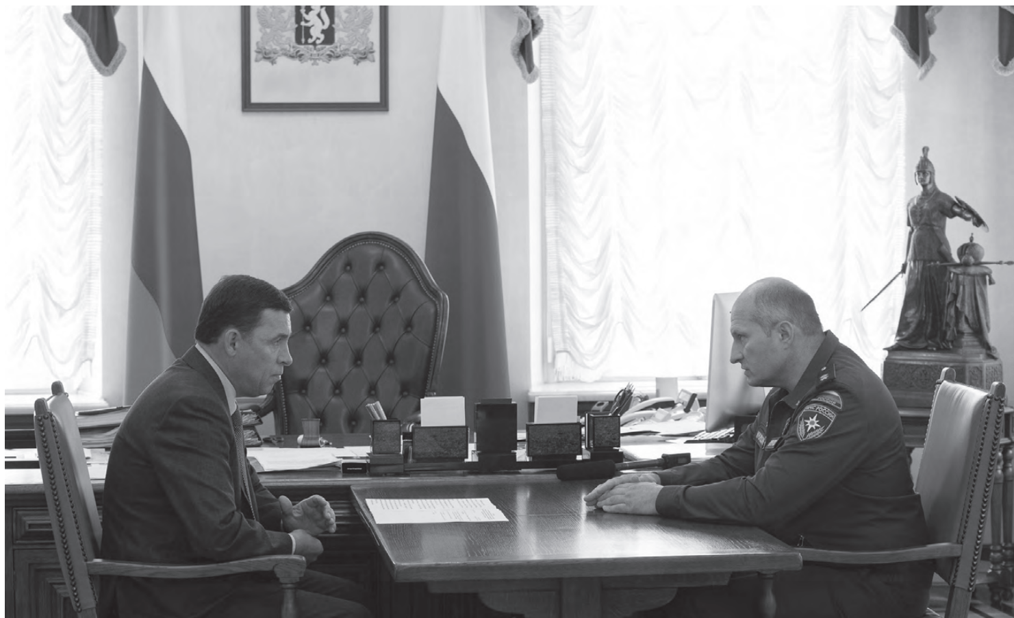
Рабочая встреча губернатора Евгения Куйвашева с главой МЧС России Александром Куренковым

В последнее время в Свердловской области было два крупных наводнения: в 2020 году затопило Нижние Серги, в 2021 году – Верхнюю и Нижнюю Салду.