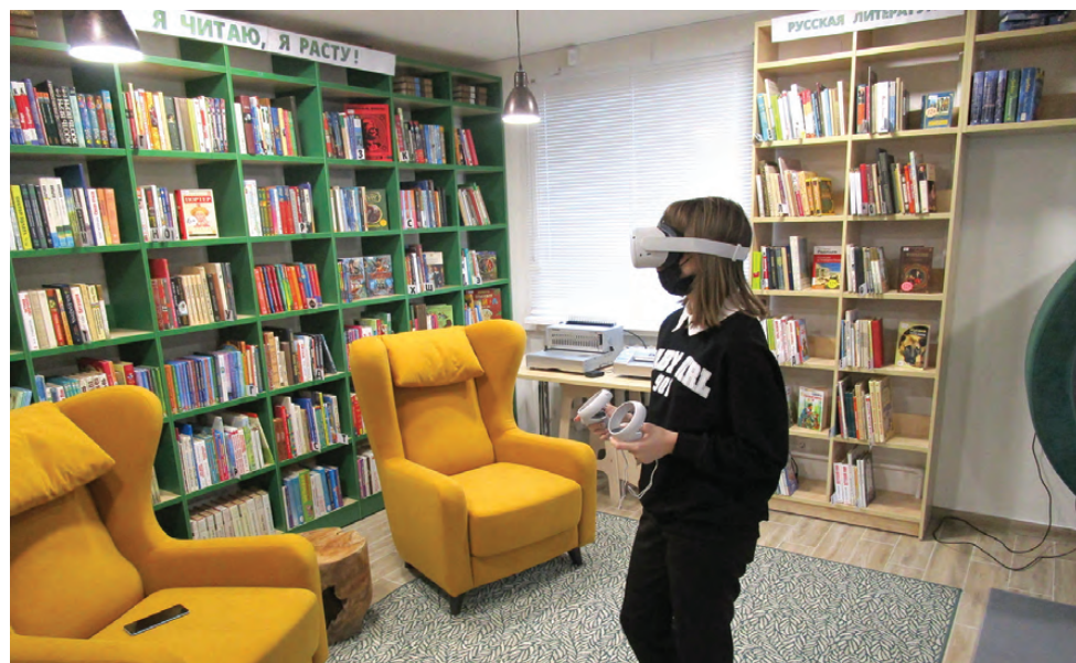
Компьютерный зал в библиотеке им. П.П. Бажова

Капитальный ремонт 18 многоквартирных домов (средства областного бюджета).