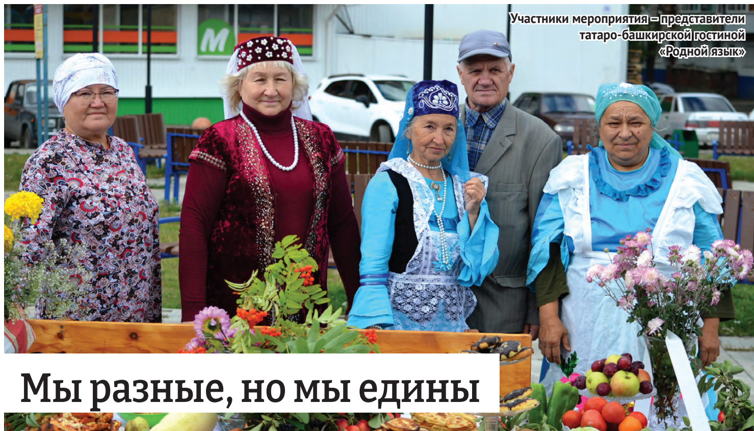
Участники мероприятия – представители татаро-башкирской гостини «Родной язык»