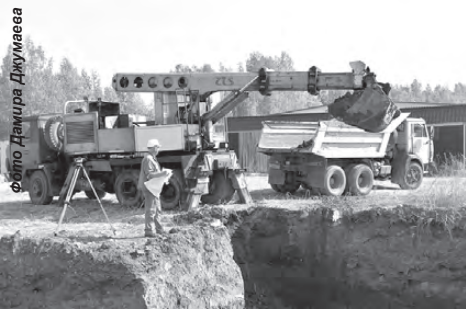
Начало строительству бани положено

Проект этого важного для города стратегического объекта разработали специалисты проектно-конструкторского отдела градообразующего предприятия. Согласно документации, площадь будущей бани составит более 200 кв. метров. Одноэтажное здание расположится за спортивной гостиницей. В бане-новостройке предусмотрено все самое необходимое: гардероб, раздевалки, помывочное отделение, парилка, административные помещения и санузел. Новый объект сможет одновременно принимать 20 человек.