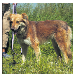
Милка, 8 мес., умная, спокойная собака, карамельно-шоколадного окраса, привита, стерилизована. Тел. 8 (904) 170-27-80, 8 (950) 649-44-62, сайт.pervo-priut.ru