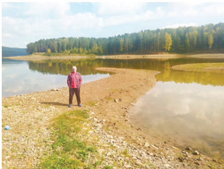
Опять обнажилось дно во второй части девятковского залива