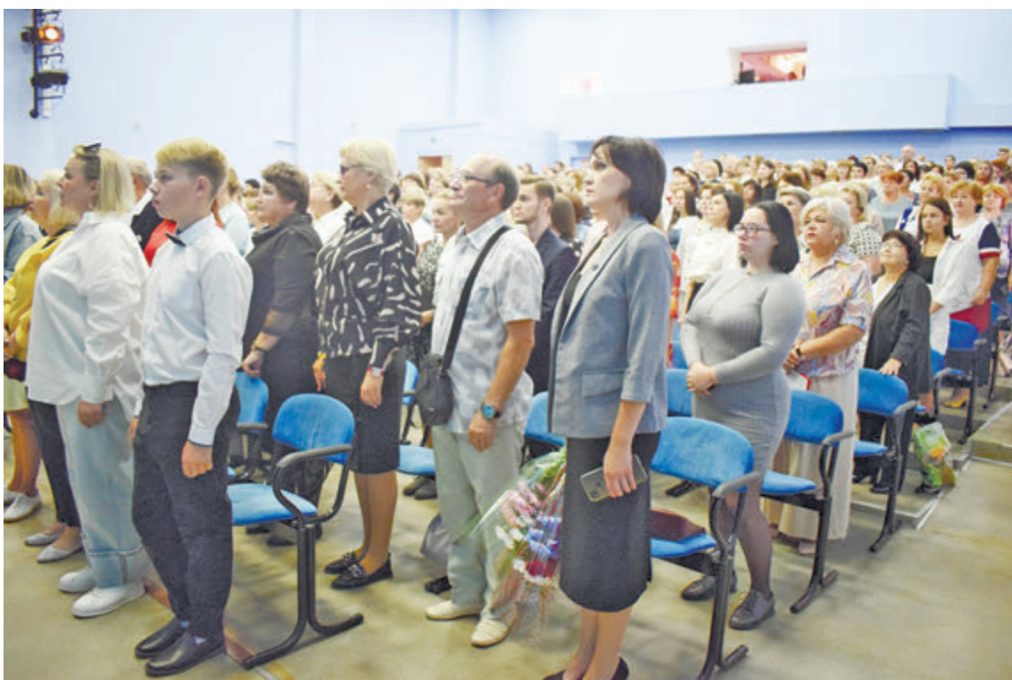
Участники конференции слушают гимн