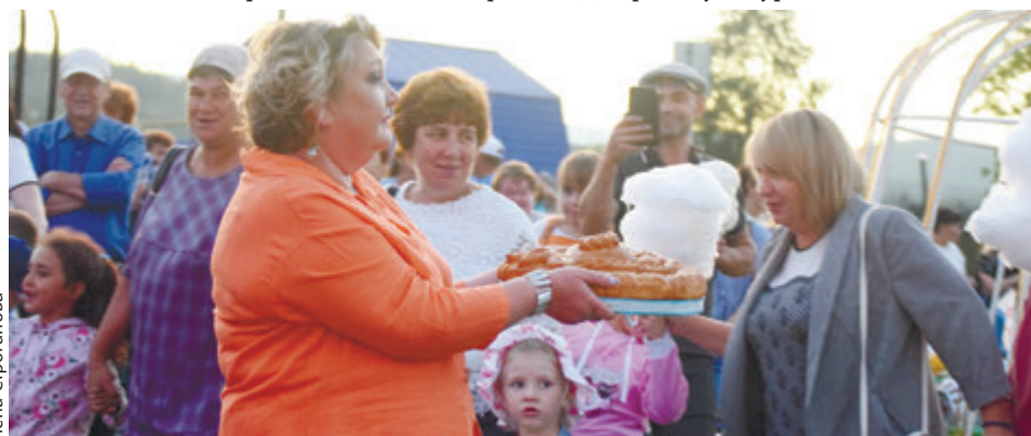
Каравай для юбиляров

На площади ДК «Горняк» работали детские развлекательные программы. Заряд положительных эмоций жителям подарила концертная программа, подготовленная артистами качканарского Дворца культуры.