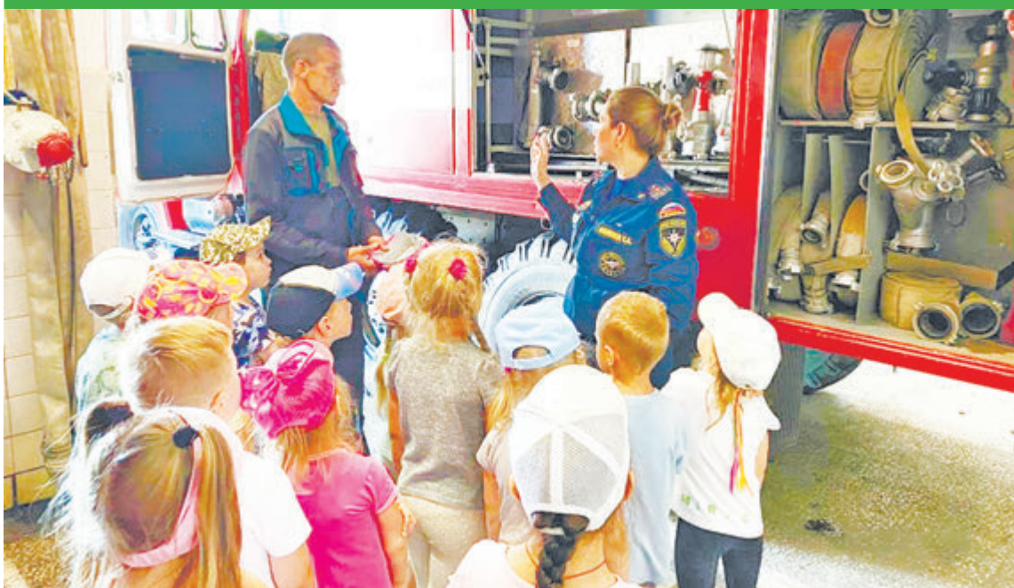
ОНД Качканарского ГО, Нижнетуринского ГО