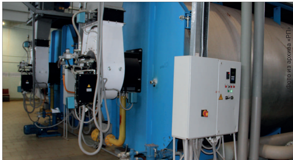
На котельной 60 МВт, построенной в 2011 году, были спроектированы два котла для нагрева воды в летний период