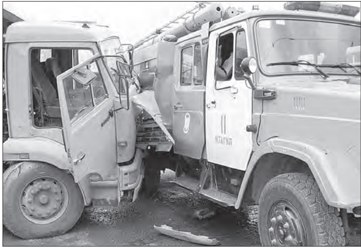
Подробности об этом происшествии читайте на 3-й стр.