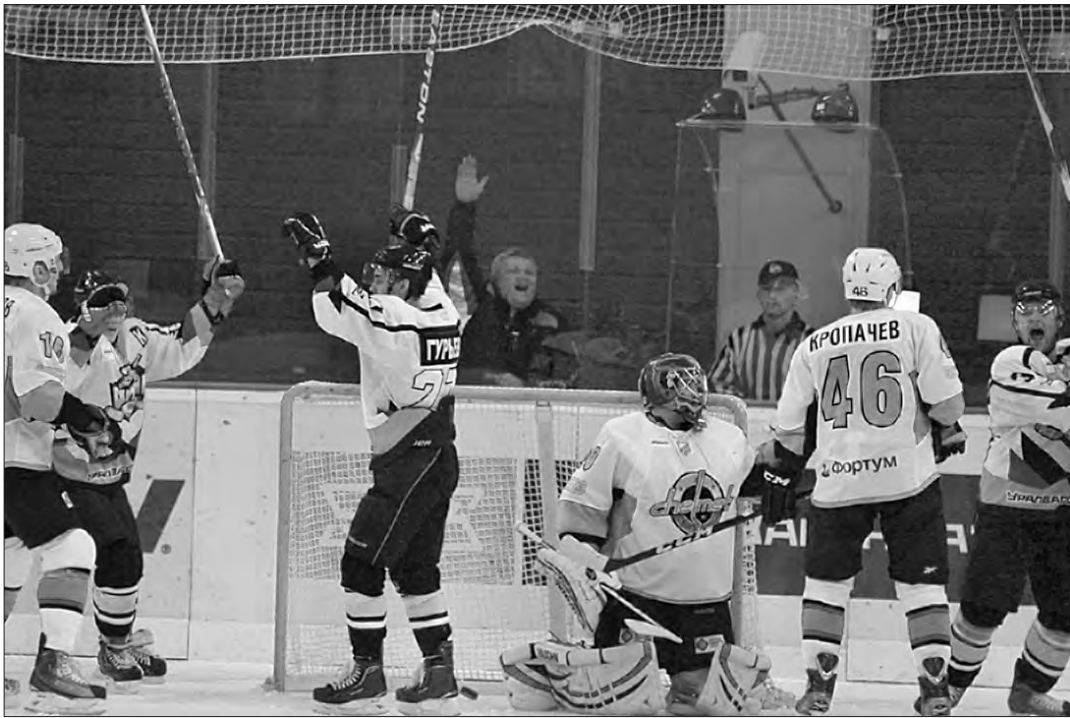
Шайба в воротах «Челмета».