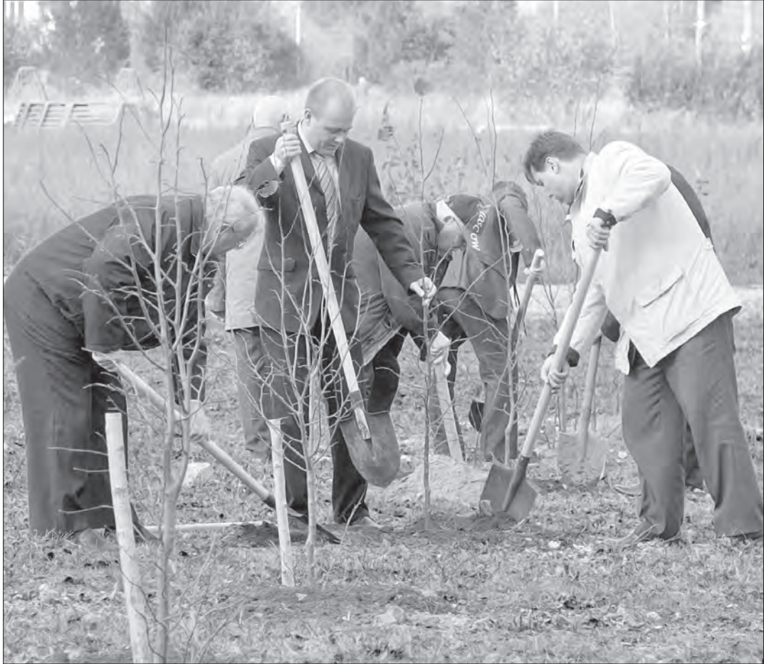
Идет высадка лип.

- Уже не один год участвуем в данном меропри-