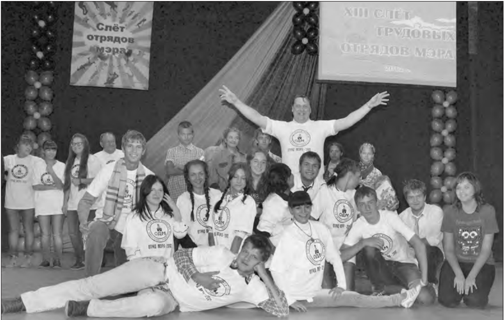
Конкурс на лучшую фотографию.