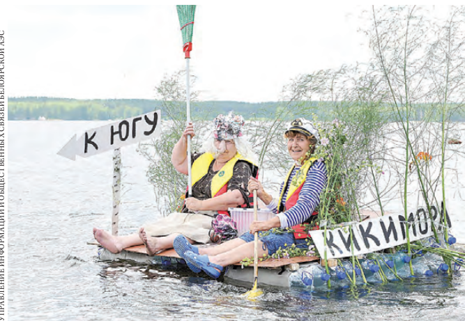
Экипаж «Кикиморы» занял третье место в номинации «Лучший костюм».