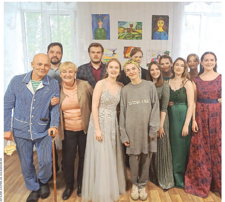
Раз в две недели волонтеры приходят в один из блоков госпиталя и дают небольшой концерт.

Сделать подобное полотно — большой страдальческий путь. Это огромный труд, как физический, так и эмоциональный. Есть халтурщики, которые возят «Фиксиков» по городам. Но я не умею ставить спектакли за два дня. Да и за месяц. Делаю по полгода. А еще деньги на них ишу по несколько лет. У меня тоже есть детские спектакли — сказки народов мира. Но ставлю подоб-