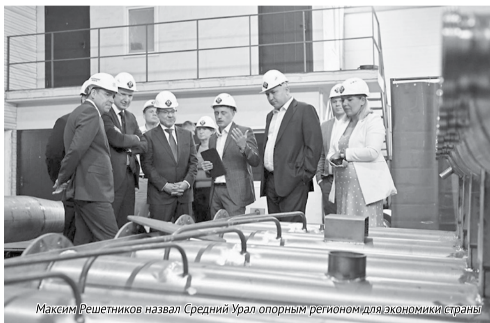
Максим Решетников назвал Средний Урал опорным регионом для экономики страны

«Свердловская область — опорный регион для экономики страны, который многого добился за последние годы. Знаю об этом не понаслышке. Будучи губернатором соседнего субъекта, наблюдал, как развивается область. Важно, чтобы вы и ваша команда смогли завершить все начатые проекты и запустить новые. У вас для этого есть все необходимое — 10-летний стаж работы губернатором, опыт преодоления не одного кризиса, конкретные результаты, доскональное знание региона. Уверен, жители видят и ценят позитивные изменения, которые произошли в жизни региона. Крайне важно, что президент поддержал вас. Со стороны министерства экономического развития России для вас всегда будет поддержка. Мы на вас так же рассчитываем, как вы на нас», — сказал Максим Решетников во время двусторонней встречи с Евгением Куйвашевым.