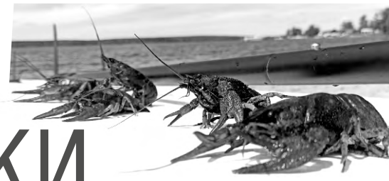
Раки 2022 года