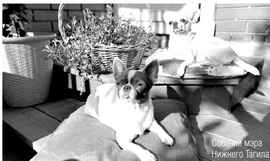
Собаки мэра Нижнего Тагила