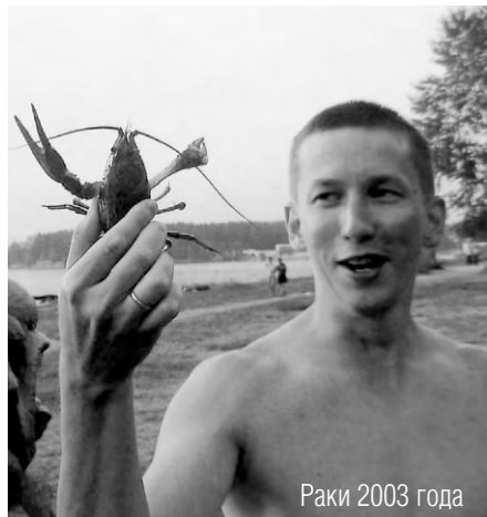
Раки 2003 года