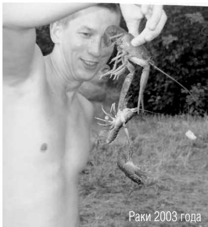
Раки 2003 года

Помню, мне охотники на раков такой способ рассказывали: разрезать