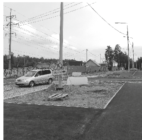
работ. Срок завершения работ - до 15 октября 2023 года».

Тем временем, пресс-служба администрации сообщила, что «на заключительном этапе до городской котельной работы ведутся в соответствии с условиями муниципального контракта и без нарушения графика производства