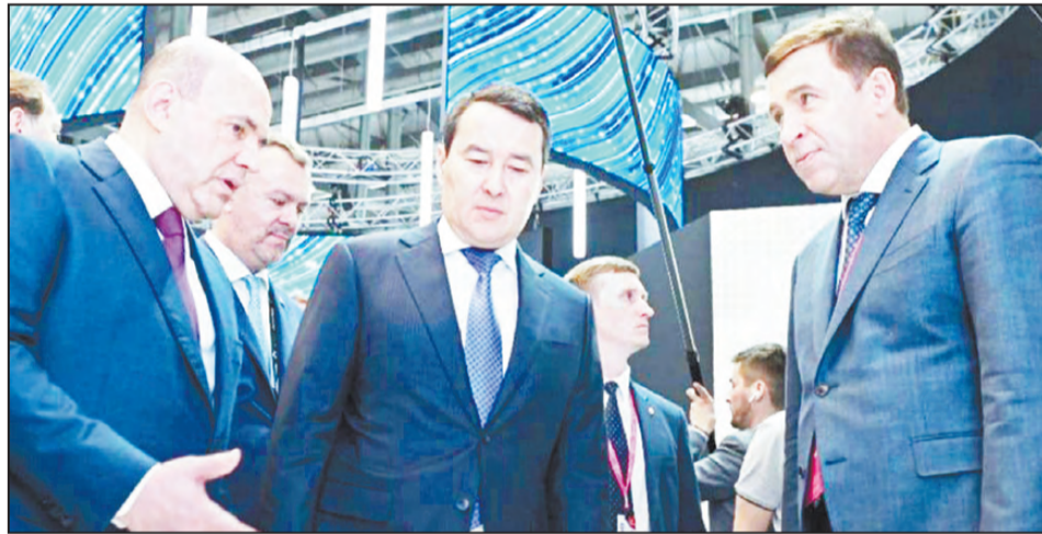
М. Мишустин, А. Смаилов и Е. Куйвашев

Премьер-министр РФ Михаил Мишустин поддержал инициативы Губернатора Свердловской области Евгения Куйвашева.