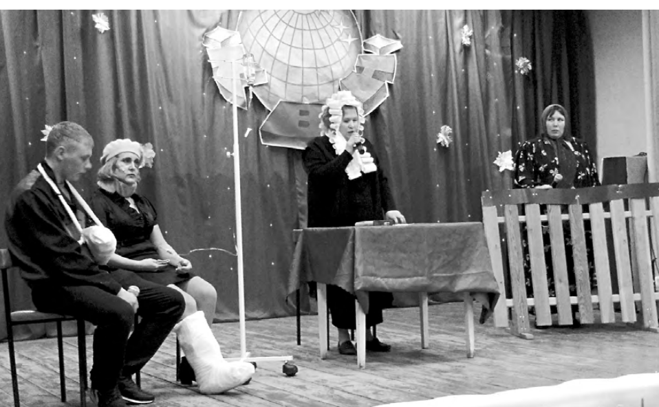
Выступление команды из Колташей: «Встать, суд идёт!»