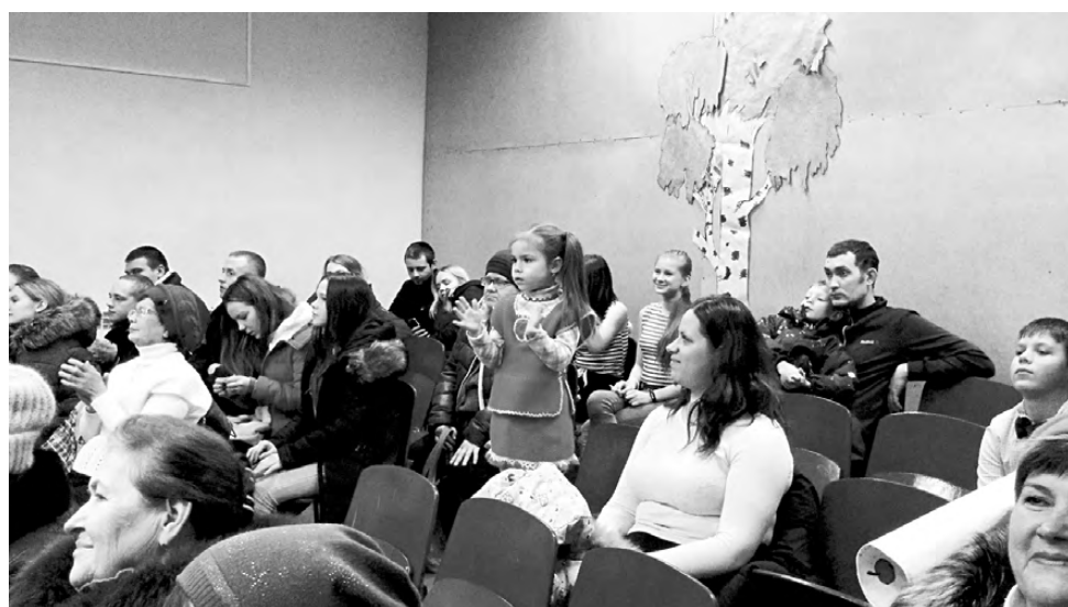
Зрители были в восторге!