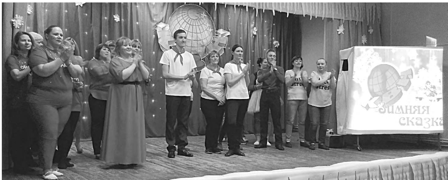
Команды-участницы районного фестиваля КВН.