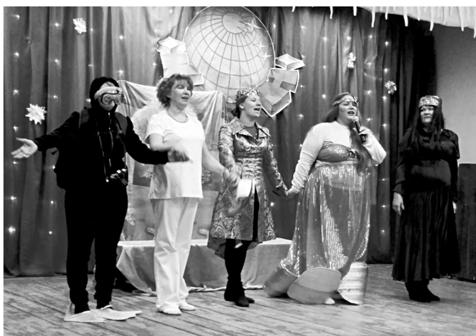
Арамашка заиграла в музыкальном конкурсе по полной программе!

зуемых действиях и как их недостатки переросли в достоинства и веру в чудеса. Участники команды «ФЭшн» показали как проходил процесс отбора талантливых, амбициозных и задорных в селе Клевакинское и набора команды для игры в КВН. «Яблоки на снегу» поделились сказочными историями из жизни деревни, волшебной работой сотрудников ГИБДД и как чтение сказки «Али-Баба и 40 разбойников» позитивно сказывается на выполнении указа президента по увеличению рождаемости в деревне Колташи. Ленкомовцы с пионерским задором дружно заявили, что всегда готовы к веселью и после распада команды КВН создали новую, «с огоньком».