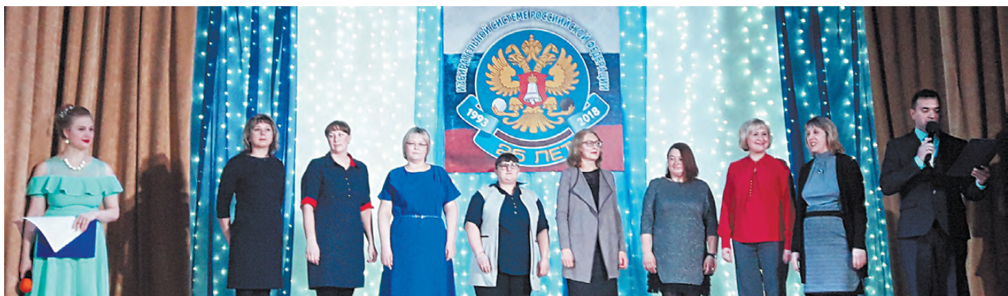
На сцене впервые назначенные члены участковых избирательных комиссий.