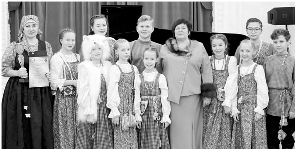
Коллективу вручён Гран-при.