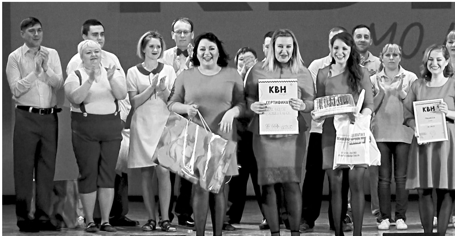
Команда «ЗХЛ» - победительница КВН-2018 в Режевском городском округе.

В третьем конкурсе все команды показали свой музыкальный потенциал. «ДиМЕДрол», записав песню, снял клип. Рок-композицией о производстве хлеба зал раскачала команда «Реж-хлеб»,