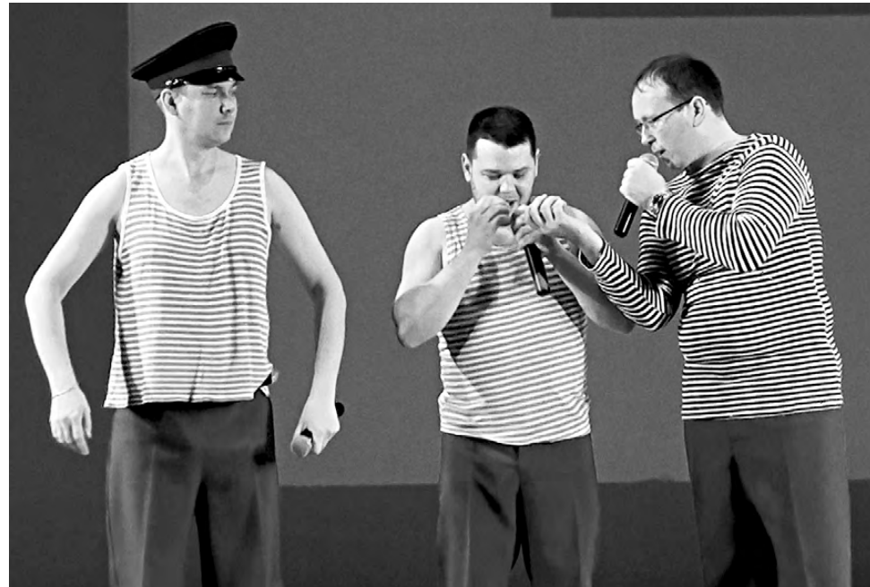
«ШОК» - это по-нашему!