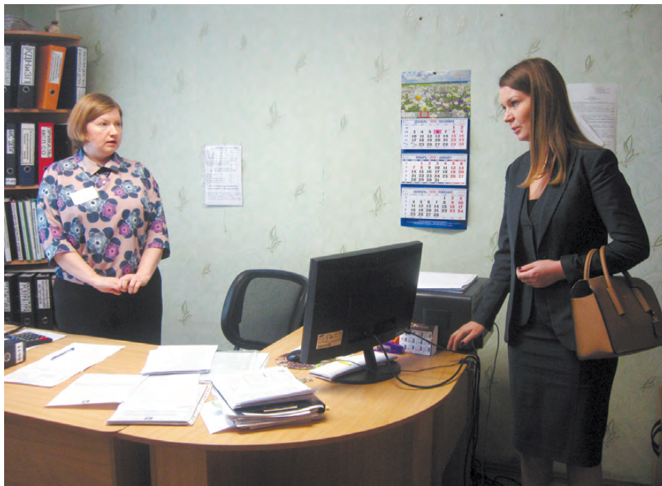
Заместитель министра подробно знакомилась с работой отделов управления социальной политики.