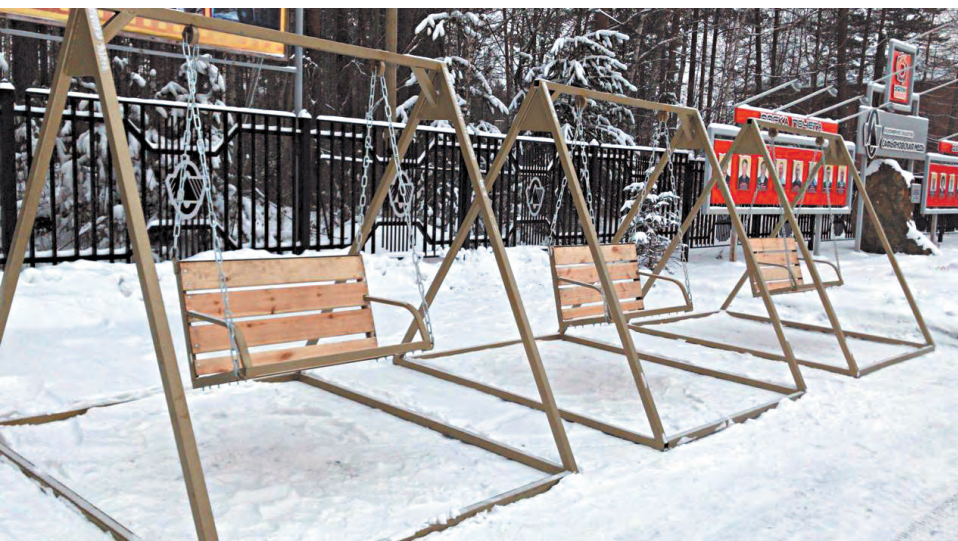
В АО «Сафьяновская медь» изготовили три новых качели-скамейки.

Такова основная задача, которую ставит перед собой Совет директоров Режевского городского округа. И результаты деятельности территориального объединения работодателей могут оценить все режевляне. Речь идёт не только о шефстве над образовательными и культурными учреждениями, которое наши предприятия осуществляют в ежедневном режиме, но и о благоустройстве округа. Об этом и говорили на очередном общем собрании Совета директоров РГО, которое состоялось 22 ноября в ООО «Режевское предприятие «ЭЛТИЗ».