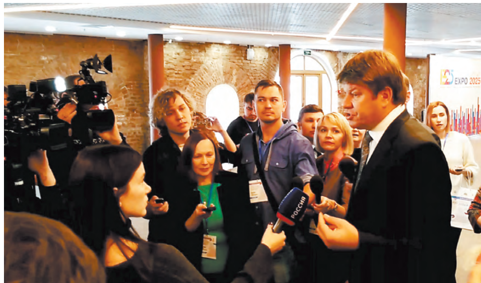
Дмитрий Губерниев поделился с журналистами впечатлениями об Уральском медиафоруме.