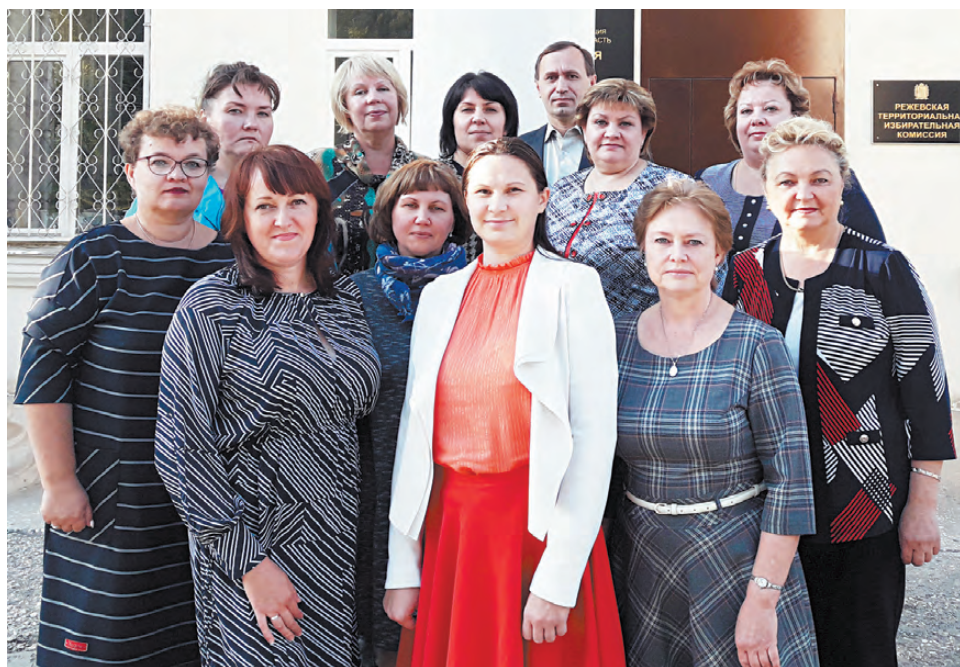
Члены Режевской территориальной избирательной комиссии.

- В 2012 году депутаты Государственной Думы внесли кардинальные изменения в принципы формирования и работы участковых избирательных комиссий, члены