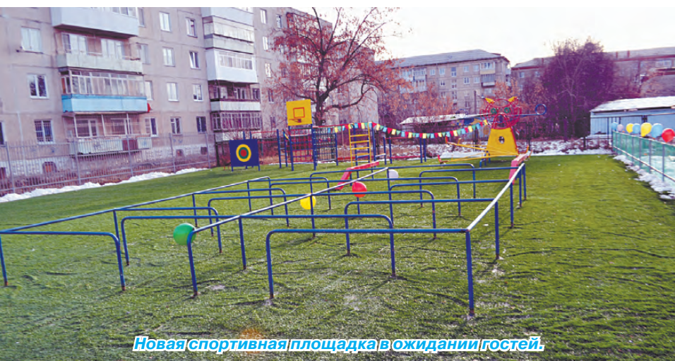
Новая спортивная площадка в ожидании гостей.

Ярко выделяется современный спортивный комплекс, строительство которого стало возможно благодаря финансированию из разных источников. Первый этап – закупка конструкций, необходимых для оборудования площадки. В рамках его реализации были задействованы средства, выделенные Министерством образования Свердловской области. Ну а для того, чтобы строительство площадки успешно завершилось, были привлечены спонсорские средства.