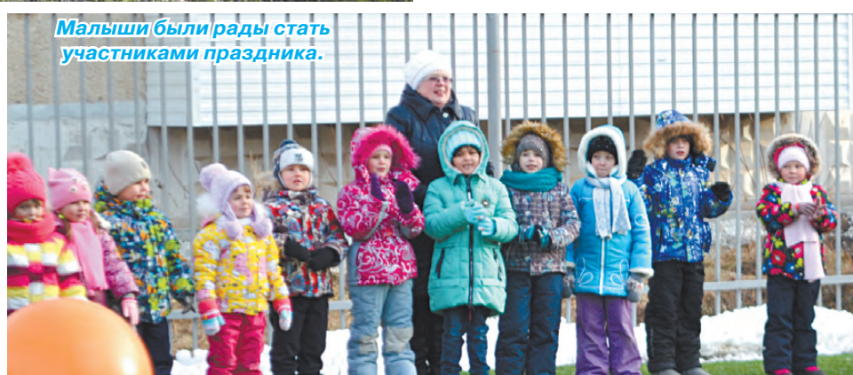
Малыши были рады стать участниками праздника.

Несмотря на зимнюю погоду, детвора детского сада подпрыгивала вовсе не от холода, ребятам не терпелось попасть за ограждение: за ним ярко зеленела искусственная трава, на которой разместились балансёр, дартс, качели, гимнастические брёвна, турники, баскетбольное кольцо,