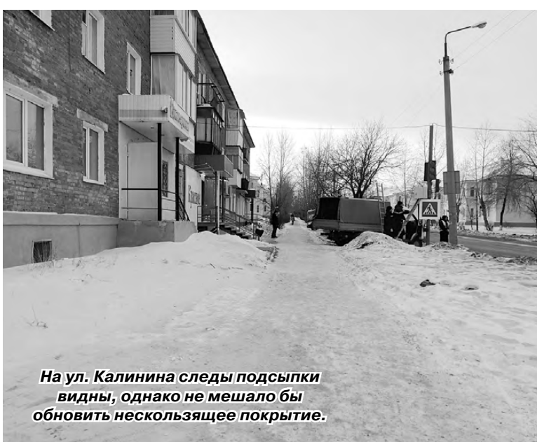
На ул. Калинина следы подсыпки видны, однако не мешало бы обновить скользкое покрытие.