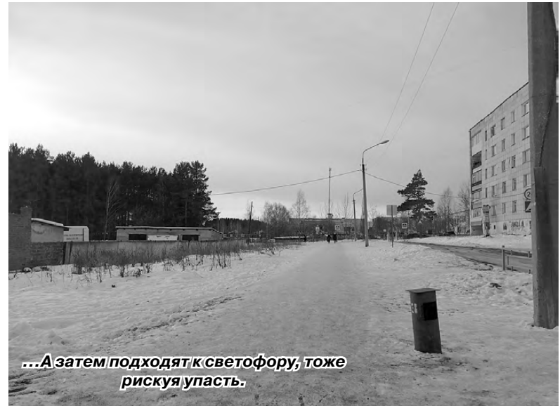
...А затем подходят к светофору, тоже рискуя упасть.