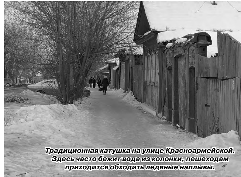
Традиционная катушка на улице Красноармейской. Здесь часто бежит вода из колонки, пешеходам приходится обходить ледяные наплывы.