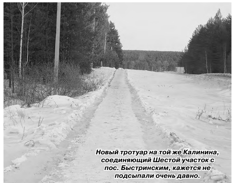
Новый тротуар на той же Калинина, соединяющий Шестой участок с пос. Быстринским, кажется не подсыпали очень давно.