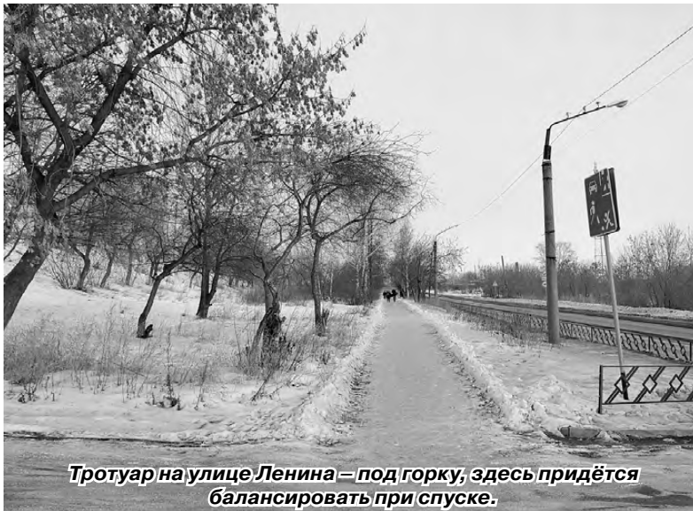
Тротуар на улице Ленина – под горку, здесь придётся балансировать при спуске.