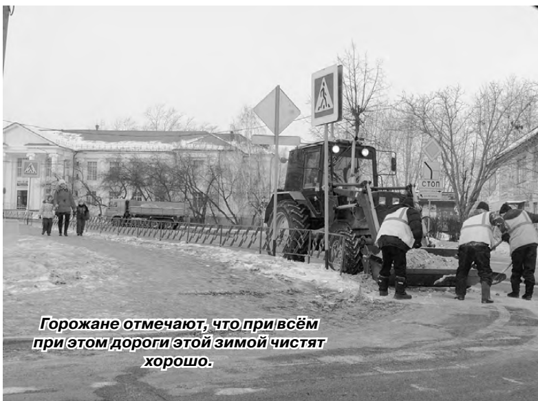
Горожане отмечают, что при всём при этом дороги этой зимой чистят хорошо.