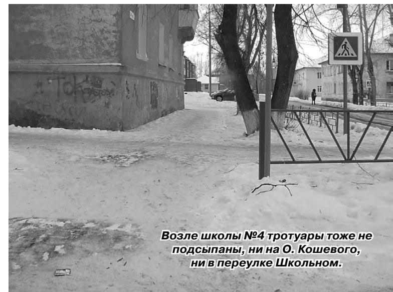
Возле школы №4 тротуары тоже не подсыпаны, ни на О. Кошевого, ни в переулке Школьном.