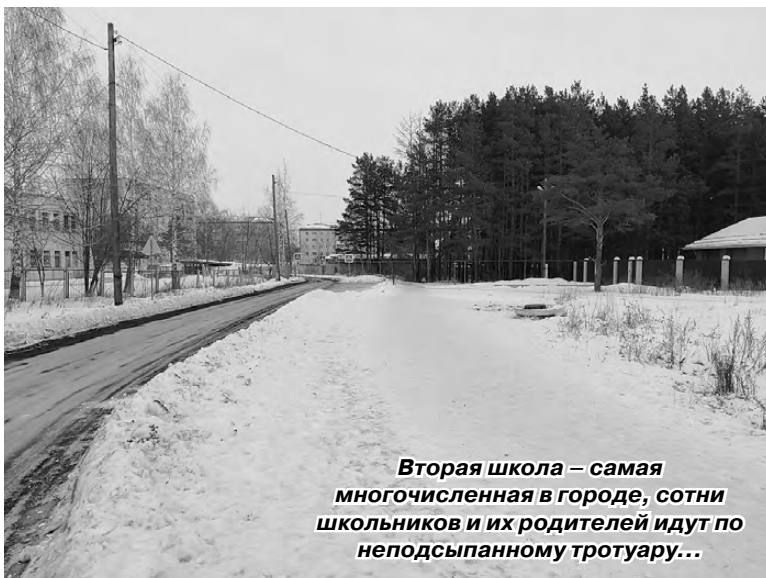
Вторая школа – самая многочисленная в городе, сотни школьников и их родителей идут по неподсыпанному тротуару...