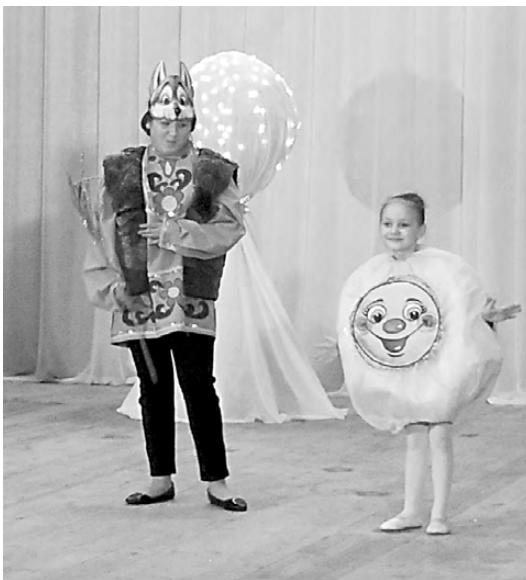
Сценка из сказки «Колобок».