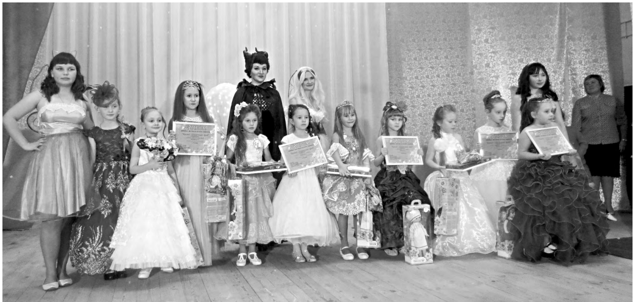
Все юные участницы праздничного мероприятия были награждены дипломами и подарками.