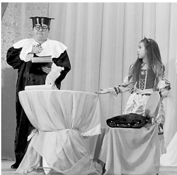
Учитель и принцесса из сказки «Двенадцать месяцев».