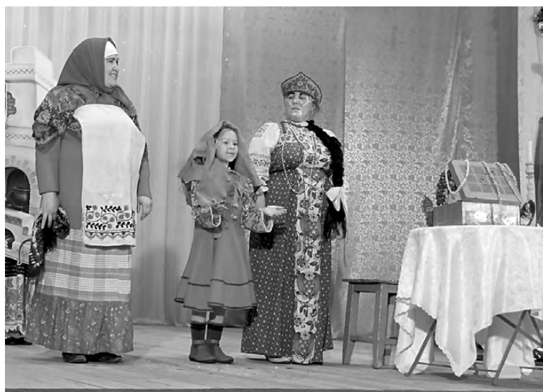
Фрагмент из сказки «Морозко» в исполнении артистов из д. Колташи.