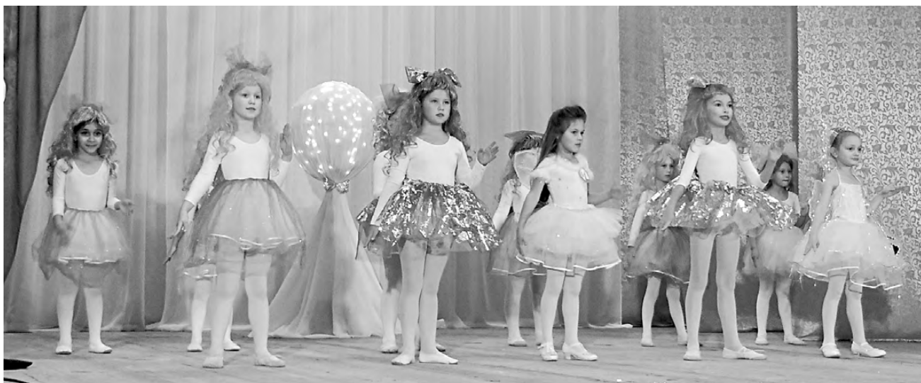
Юные артисты блистали талантами и нарядами.