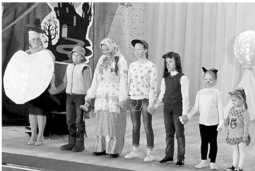
Артисты из с. Каменка прекрасно сыграли в сказке «Репка».