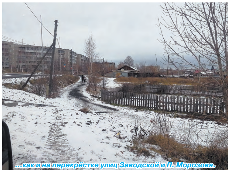
...как и на перекрёстке улиц Заводской и П. Морозова.