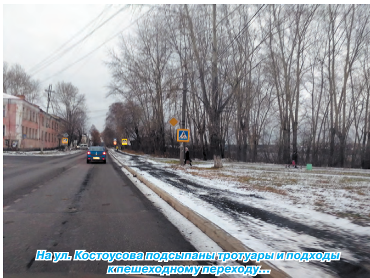
На ул. Костоусова подсыпаны тротуары и подходы к пешеходному переходу...