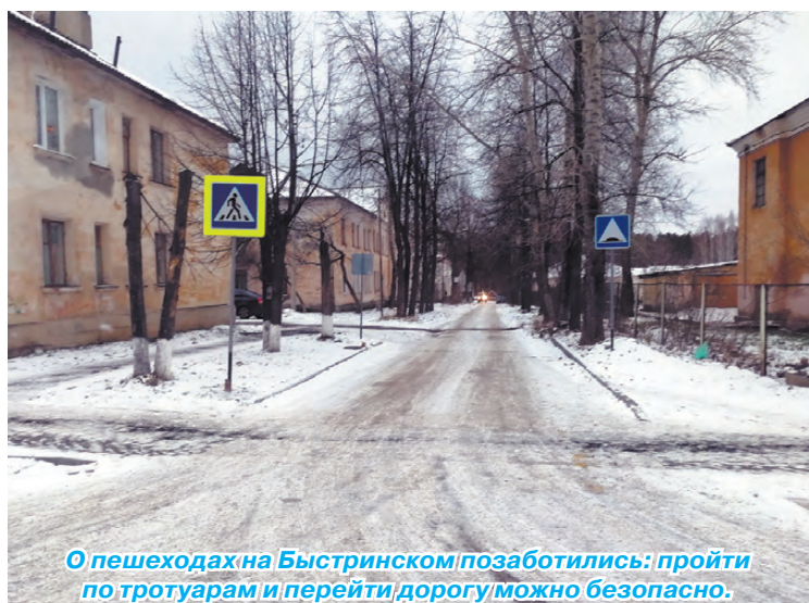
О пешеходах на Быстринском позаботились: пройти по тротуарам и перейти дорогу можно безопасно.