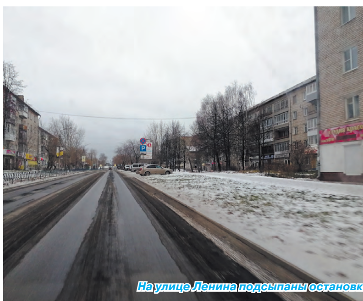
На улице Ленина подсыпаны остановки и проезжая часть, а вот тротуары – нет.