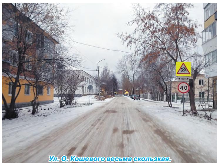
Ул. О. Кошевого весьма скользкая.