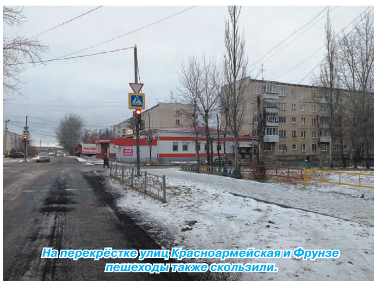
На перекрёстке улиц Красноармейская и Фрунзе пешеходы также скользили.