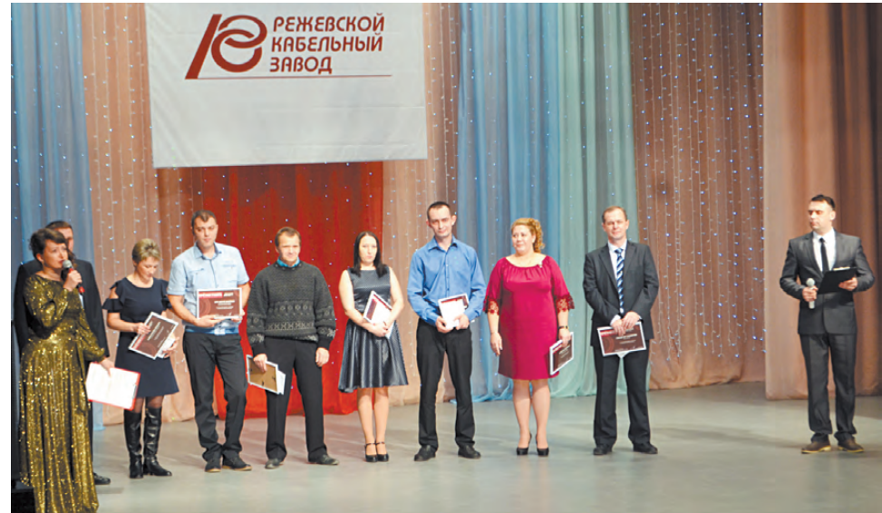
Лучшим работникам – почётные грамоты.

За 27 лет существования ООО «Режевской кабельный завод» стало одним из