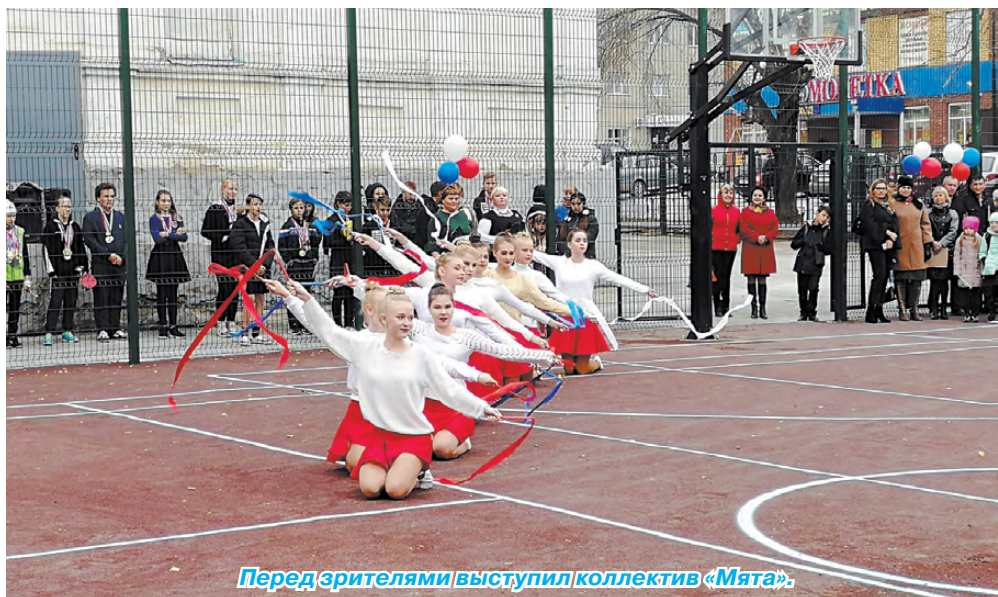
Перед зрителями выступил коллектив «Мята».