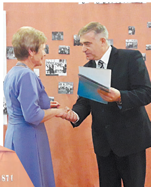
Педагогов школы №13 наградила глава администрации РГО Владимир Шлегель.