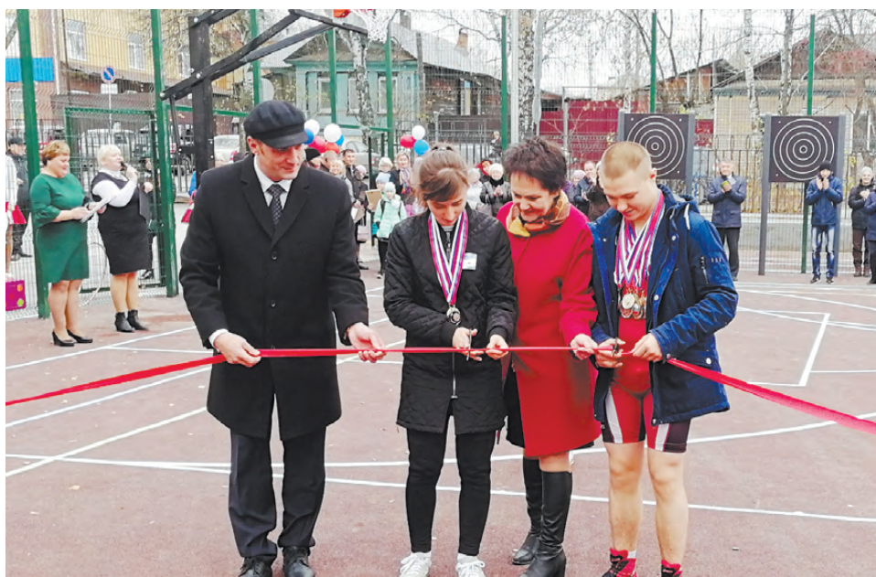
Следуя традиции, почётные гости перерезали красную ленту.

Для того чтобы всё это появилось на территории школы №5, были задействованы средства из областного и местного бюджетов в равных пропорциях. Общая сумма контракта составила 10,5 миллиона рублей, половина из которых была выделена Министерством образования Свердловской области. Строительство велось на протяжении месяца – с 17 сентября по 17 октября, тёплая осенняя погода позволила подрядчикам выполнить все работы в срок.