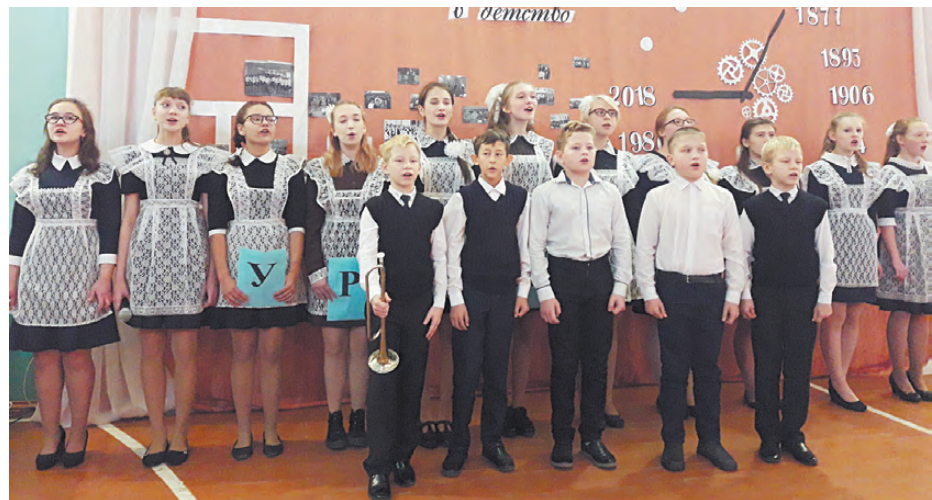
Ученики Черемисской школы не только умные, но и творческие личности.