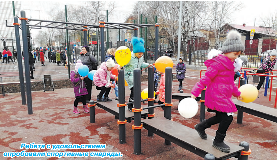
Ребята с удовольствием опробовали спортивные снаряды.