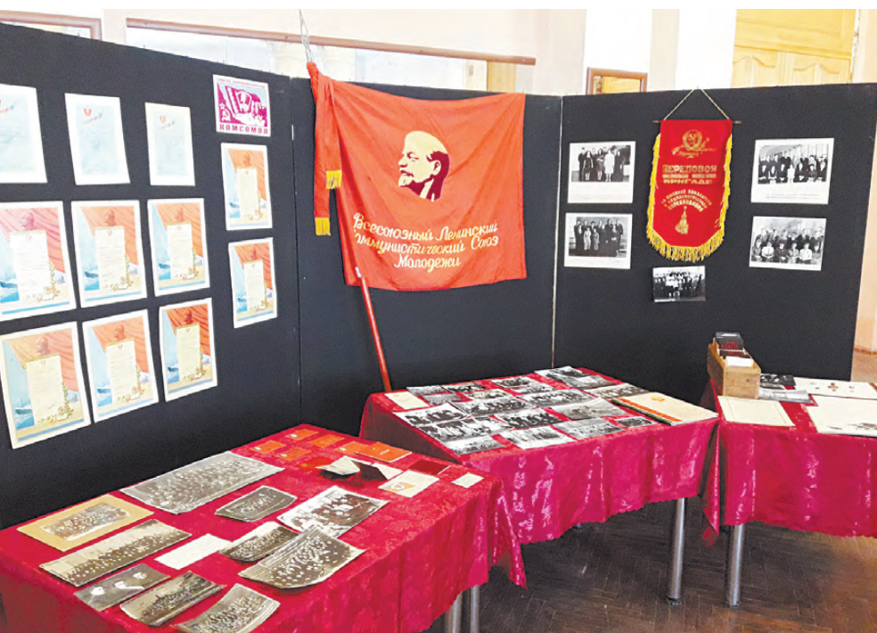
Выставка в Центре культуры и искусств.