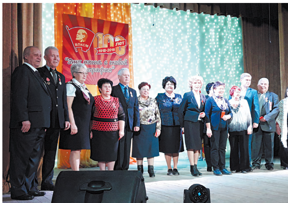
Заслуженных комсомольских лидеров Режа прошлых лет наградили Почётным орденом «100 лет Ленинскому комсомолу».