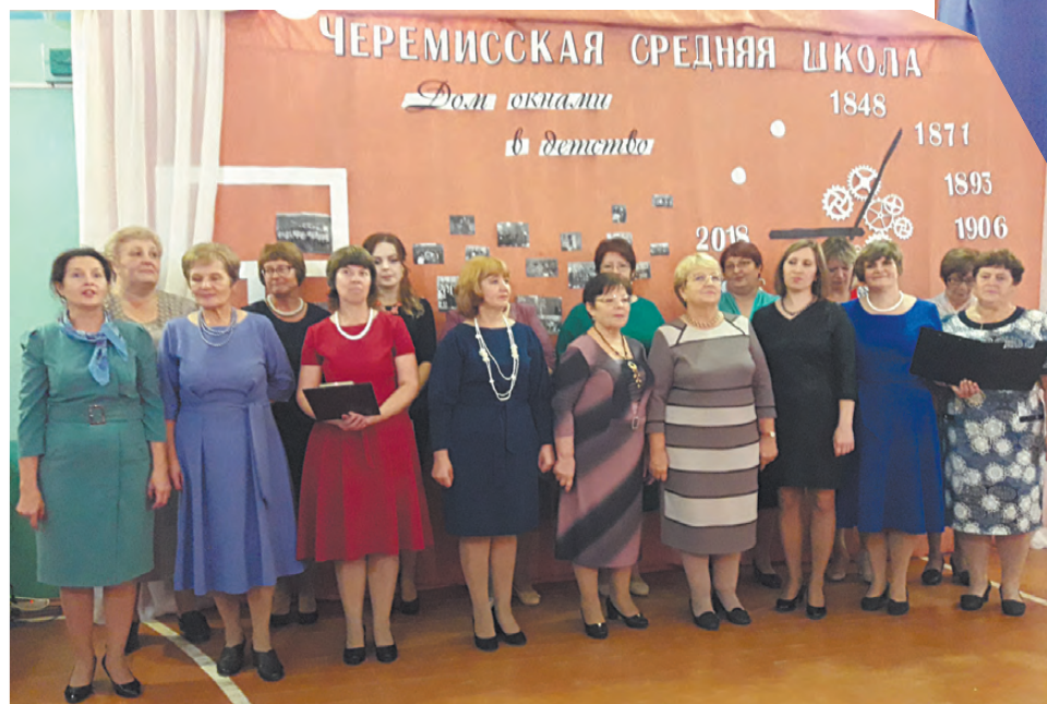
Педагогический коллектив школы №13.

Хороший подарок незадолго до юбилея получила школа села Черемисского. По областной программе этому образовательному учреждению выделен новый школьный автобус.