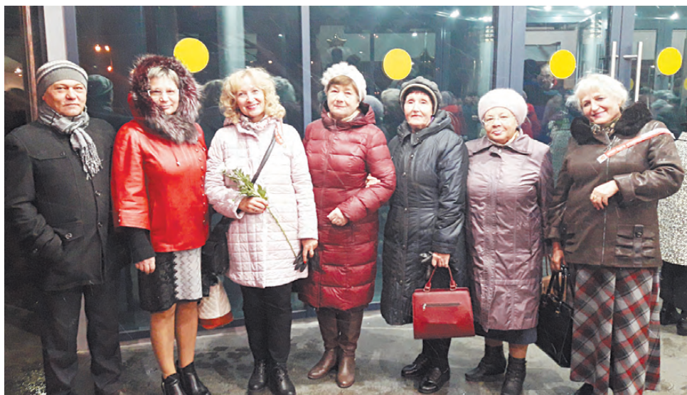
Режевляне стали участниками областного торжества, посвящённого вековому юбилею комсомола.

Комсомол был ударной силой и в развитии Свердловской области. Благодаря всеобщим комсомольским стройкам в области построена Белоярская атомная станция и городок атомщиков Заречный, Качканарский горно-обогатитель-