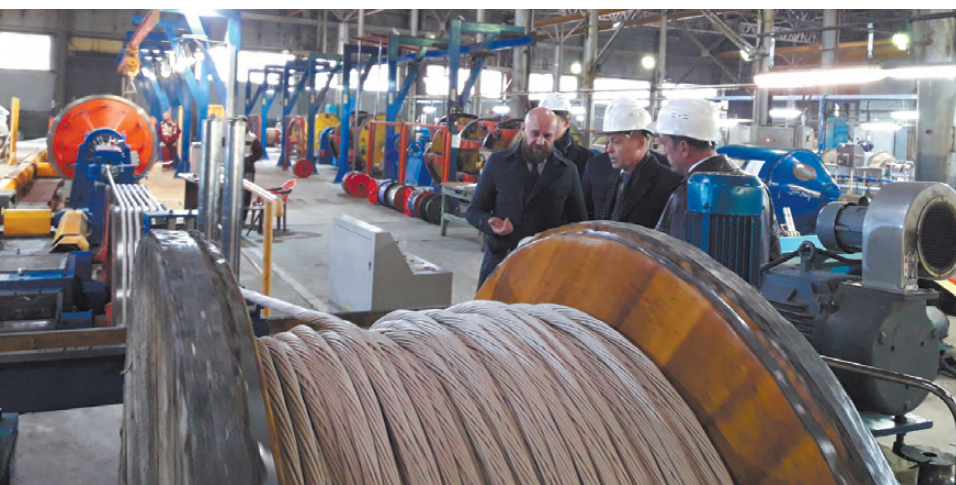
Министр промышленности и науки Свердловской области Сергей Пересторонин во время визита в Реж оценил мастерство работников предприятия «Режкабель» и качество производимой здесь продукции.

Ирина ВЕНЕДИКТОВА.