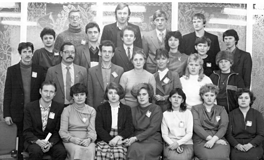
Делегаты 49-й Режевской городской отчётно-выборной комсомольской конференции. 1986 год.