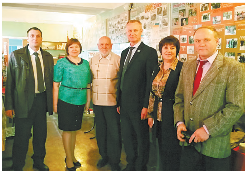
На экскурсии в музей школы №23.