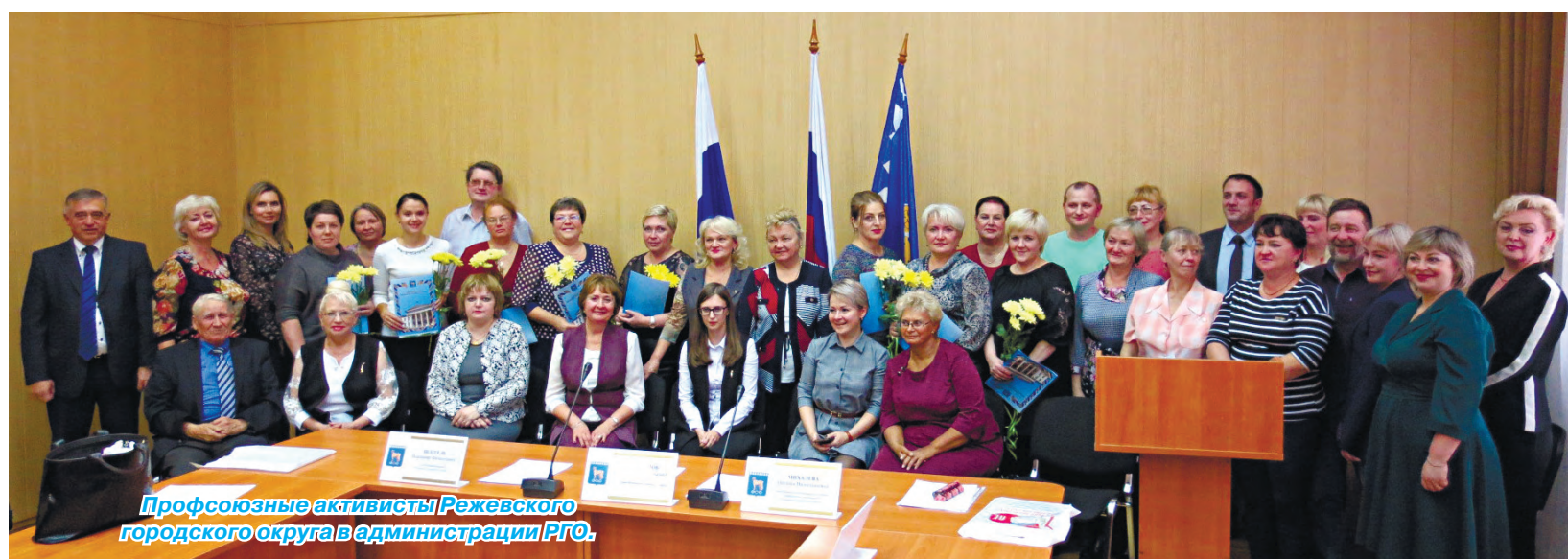
Профсоюзные активисты Режевского городского округа в администрации РГО.

- В Режевском городском округе восемь профсоюзных организаций, которые включают в себя более двух тысяч работников предприятий. Администрация плодотворно взаимодействует с профсоюзами и общественными организациями. У нас есть общие задачи. На повестке дня остаются вопросы охраны труда, социального партнёрства и обсуждение пенсионного законодательства. Считаю, что мы и в дальней-