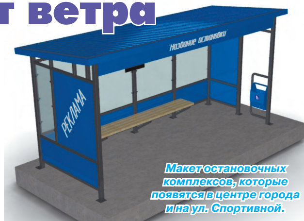
Макет остановочных комплексов, которые появятся в центре города и на ул. Спортивной.

На протяжении трёх лет в Реже реализуется «Комплексная программа развития РГО на 2016-2021 годы», утвержденная Правительством Свердловской области. Глава региона держит её выполнение на личном контроле и за прошедшее время неоднократно приезжал в наш город. Программа направлена на улучшение качества жизни режевлян, организацию в городе комфортного жилого пространства. И Реж ждут новые позитивные перемены.