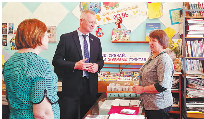
Библиотекарь Глинской школы рассказала о том, что ученики по-прежнему активно читают книги.