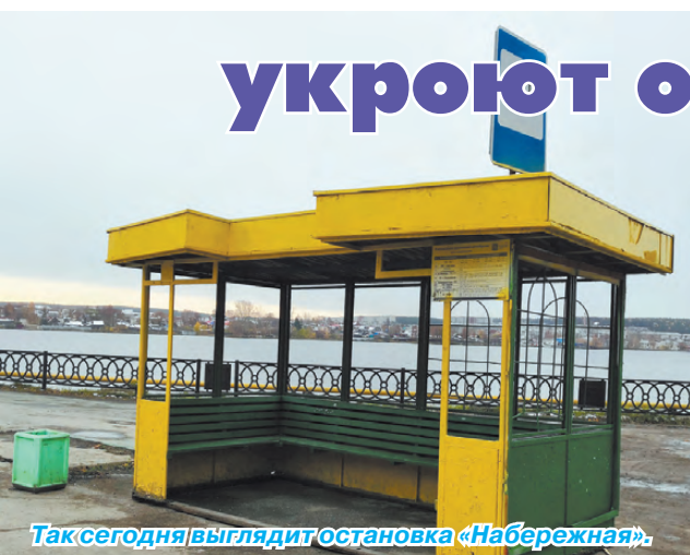
Так сегодня выглядит остановка «Набережная».