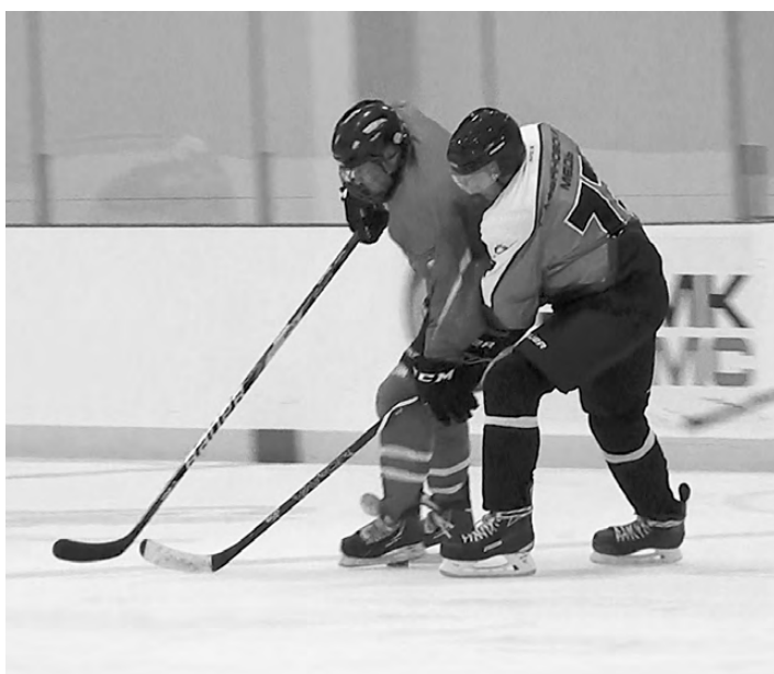
Борьба за шайбу.

и даже маленькая потасовка, которую вовремя пресёк судья встречи, отправив зачинщиков на скамью штрафников.