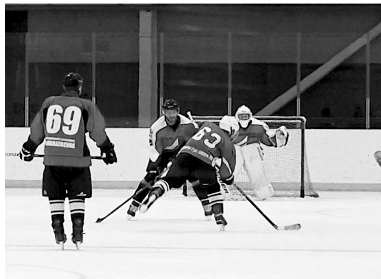
Опасный момент у ворот «Сафьяновской меди».