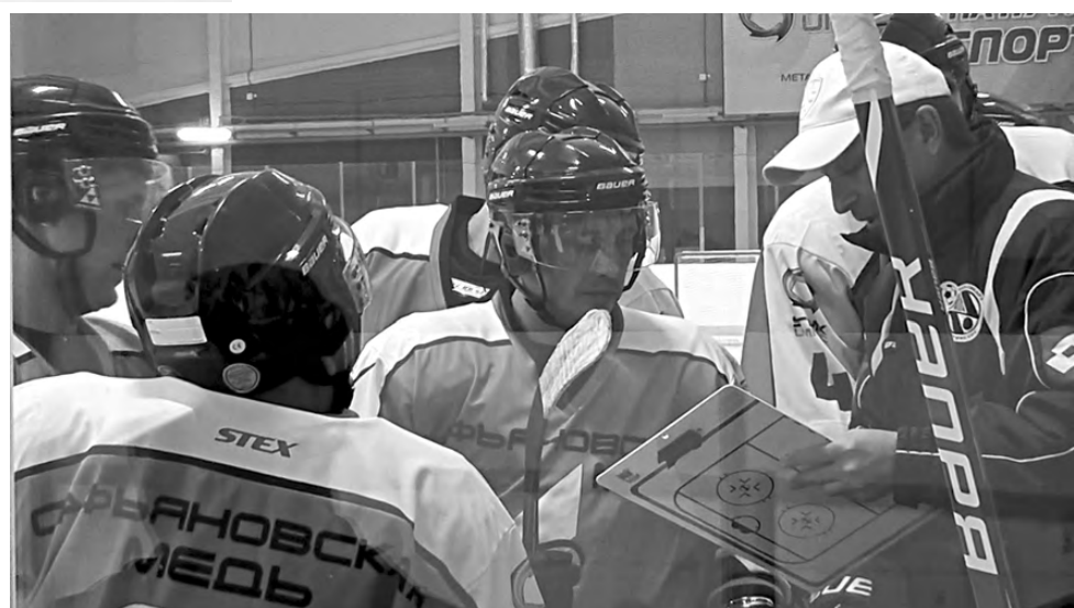
В перерыве тренер даёт игровые установки игрокам.