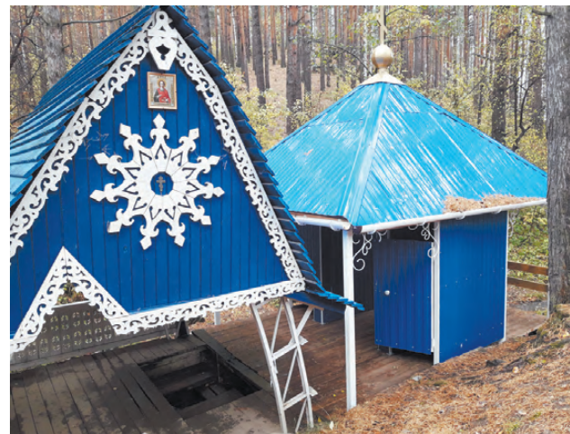
Новые купели на роднике Пробойный ключ.

- Работы велись поэтапно. Всё зависело от наличия средств. Появлялись деньги, продолжалось строительство, - говорит