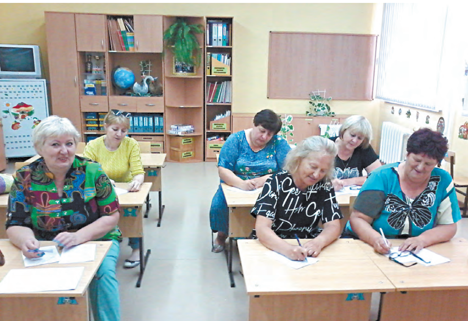
Члены избирательной комиссии изучают выборное законодательство.

Людмила НИКОНОВА.