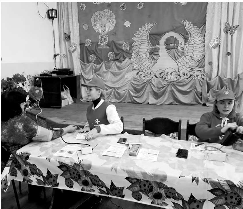
О важности и необходимости ежедневного мониторинга артериального давления жителям села рассказали волонтеры.