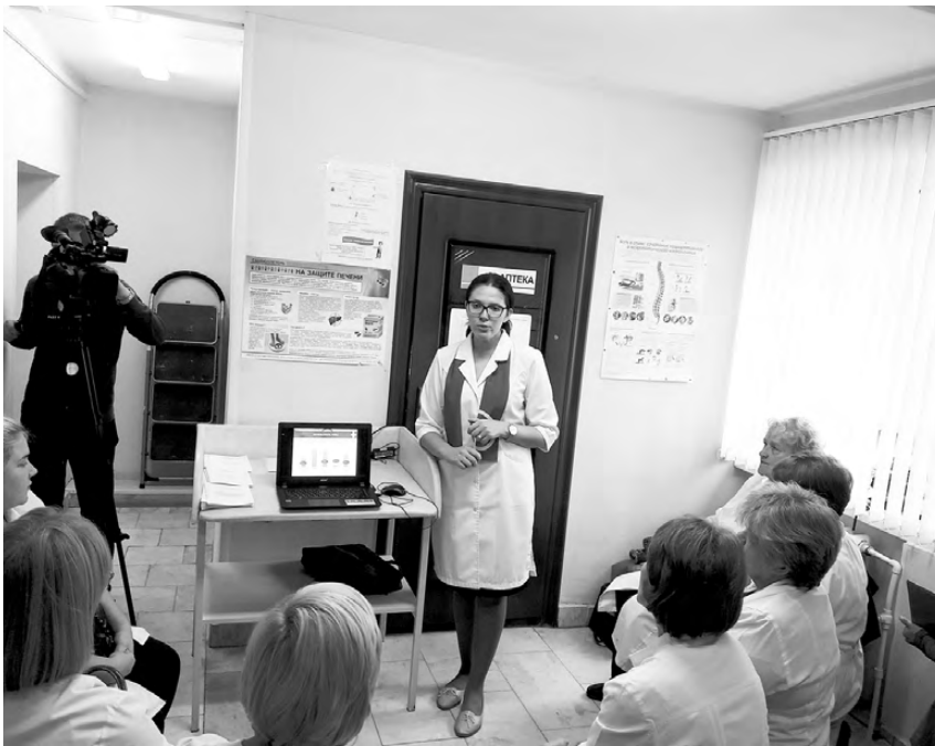
Медики Режевского городского округа прослушали лекцию о том, как правильно ухаживать за больными с пролежнями.