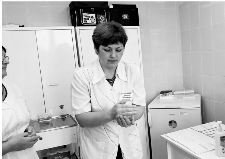
Тест на чистоту рук.