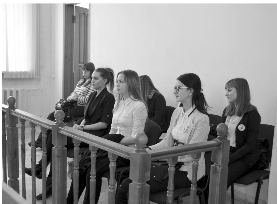
Скоро скамьи, где сидят учащиеся РПТ, смогут занять присяжные заседатели.

помощников судей. В своём выступлении он отметил введение инновационных технологий, в частности, использование для вызова в суд СМС-сообщений, электронных повесток; проведение судебных процессов с применением видеоконференц-связи, аудио-протоколирования, обратил внимание на то, как используется сервис «подача процессуальных документов в электронном виде».