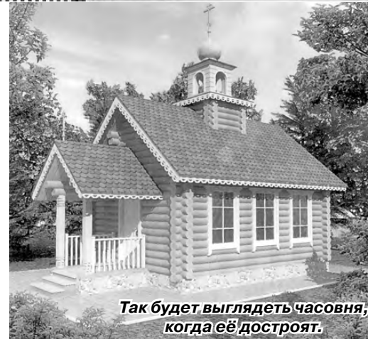
Так будет выглядеть часовня, когда её достроят.

ится. Не так быстро, как хотелось бы, но строится. Честь и хвала, низкий поклон всем, кто занимается этим благим делом, кто принимает в этом посильное участие. Заказан купол часовни, и я верю, что работа по строительству часовни будет доведена до конца. Бог вам в помощь!