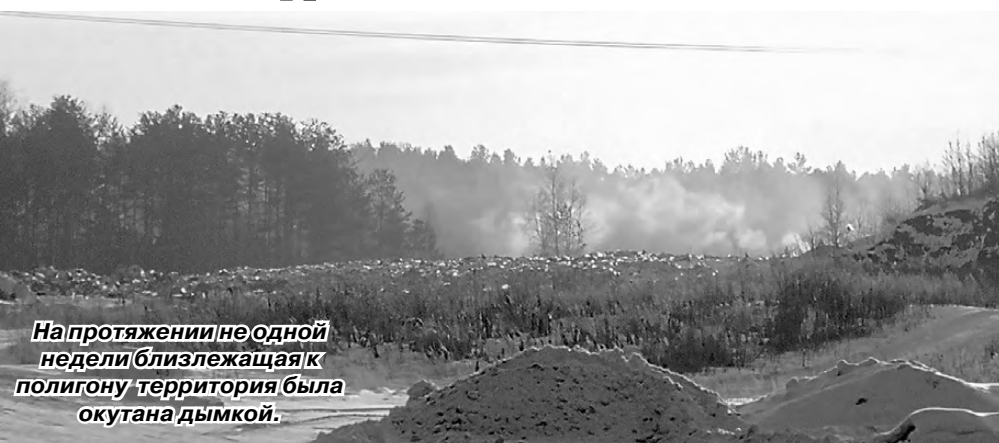
На протяжении не одной недели близлежащая к полигону территория была окутана дымкой.

На протяжении двух недель работники близлежащих к полигону предприятий целыми днями чувствовали резкий запах дыма. И дело здесь совсем не в деятельности их предприятий. Дымил полигон, где МУП «Чистый город» производит захоронение бытовых отходов. Площадь возгорания была немаленькая, возможно, источников появления дыма было несколько. Ветер же относил весь смог в сторону предприятий, сизая дымка покрыла окрестности.