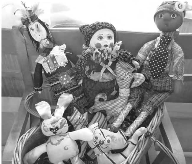
Поделки соколовских мастериц хорошо раскупаются на ярмарках народного творчества.

содержать агрокомплекс «Соколово», иначе водопровод вряд ли бы функционировал. На баланс МЖКУПа водопровод не поставлен: невыгодно ремонтировать. Власти склоняют население к тому, чтобы бурили скважины, но на это каждому потребуется ещё около ста тысяч рублей. Многим не под силу.