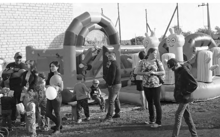
В день рождения с. Липовского работали развлекательные площадки для детей.