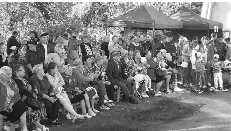
Жители с. Липовское с удовольствием смотрели праздничный концерт.