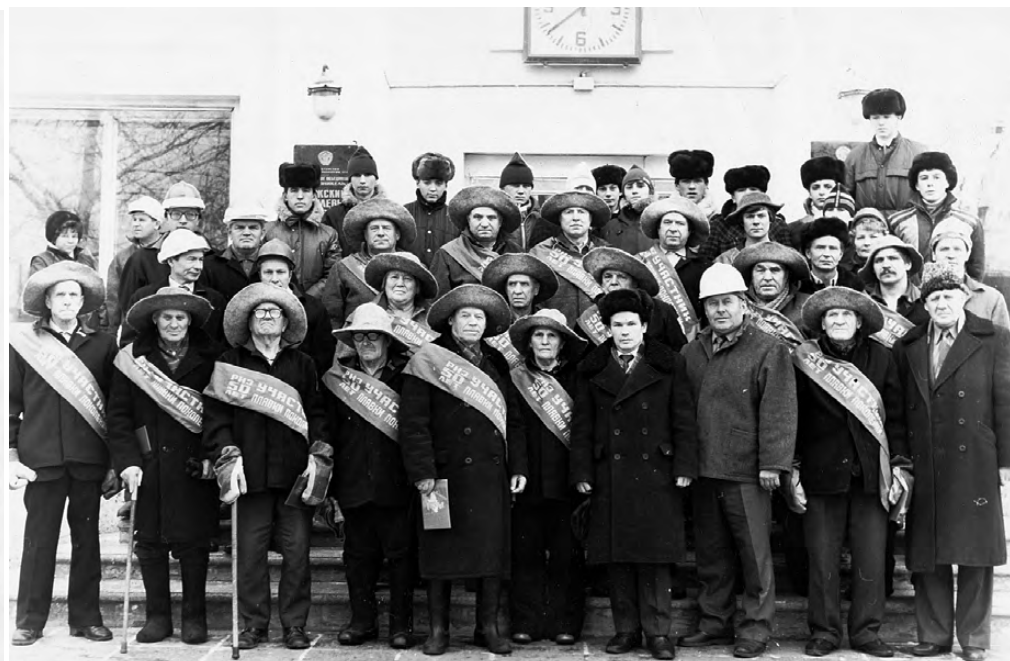
Участники плавки поколений в честь 50-летия Режевского никелевого завода. 13 ноября 1986 года.