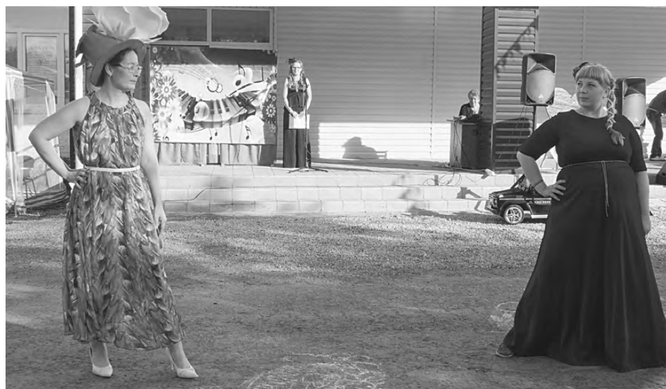
Конкурс шляп: красиво, модно, креативно.