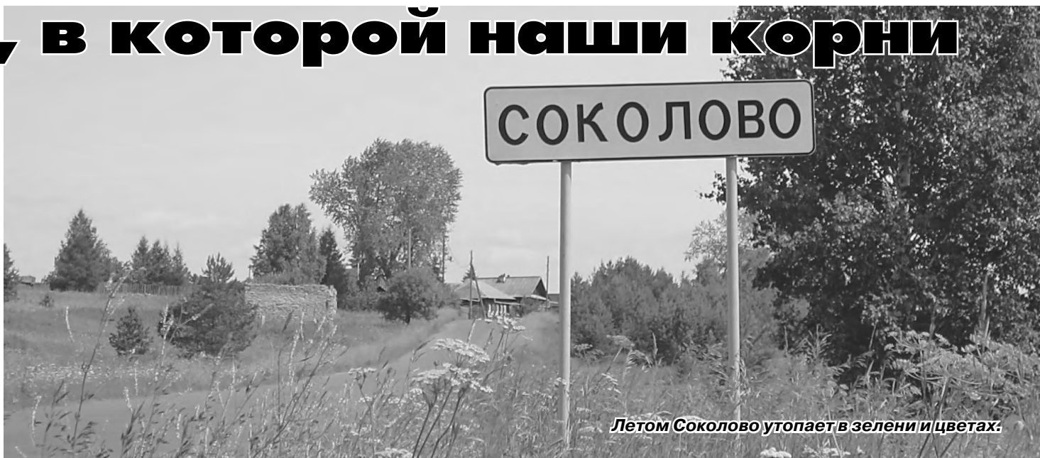
Летом Соколово утопает в зелени и цветах.

Всеми силами жители Соколово стараются поддерживать жизнь в своей деревне. Большой удачей считают то, что добились прокладки газопровода, хотя голубое топливо, как говорится, влетело в копеечку. Пока газом пользуются 8 семей, которым удалось найти нужную сумму, а это 200-250 тысяч рублей. А впереди маячит опасность лишиться водопровода. Он ветхий, проложен в 1983 году. Спасибо, что водонапорную башню взялся