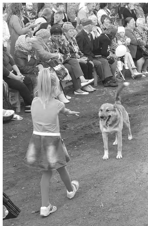
И такие гости были на мероприятии: собаке тоже понравился праздник и внимание детей.