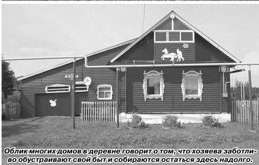
Облик многих домов в деревне говорит о том, что хозяева заботливо обустривают свой быт и собираются остаться здесь надолго.