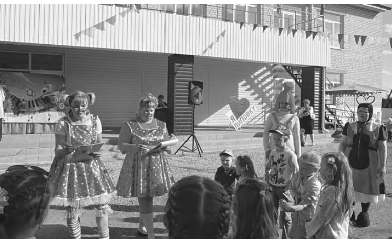
Детский праздник для юных жителей села.