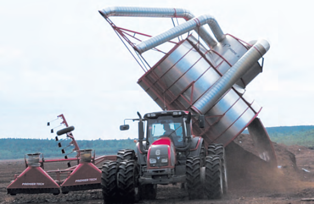
На торфяном месторождении работает современная техника.