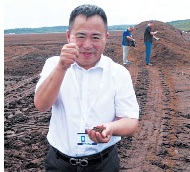
Большой палец вверх! Похоже, товар хорош.