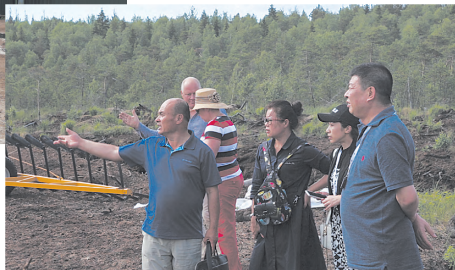
Гости с интересом наблюдают процесс добычи торфа.

В ноябре 2017 года в КНР прошёл 19 съезд Коммунистической партии Китая. Страна вступила в 13-ю пятилетку. Сегодня вклад Китая в мировую экономику превышает 30%. КПК поставила задачу к 2035 году построить модернизированную инновационную экономику с серьёзной природосберегающей составляющей. Для этого запускается экологическая программа «Прекрасный Китай», цель которой - коренным образом улучшить экологию и плодородие почв. Китай приступил к созданию системы оздоровления окружающей среды, выполнению мероприятий по озеленению страны. Принимаются меры против опустынивания, окаменения, потерь влаги и почв. Для этих целей китайцы готовы закупать торф.