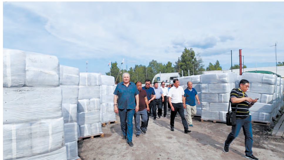
Продукция предприятия отправляется потребителям в удобной упаковке.