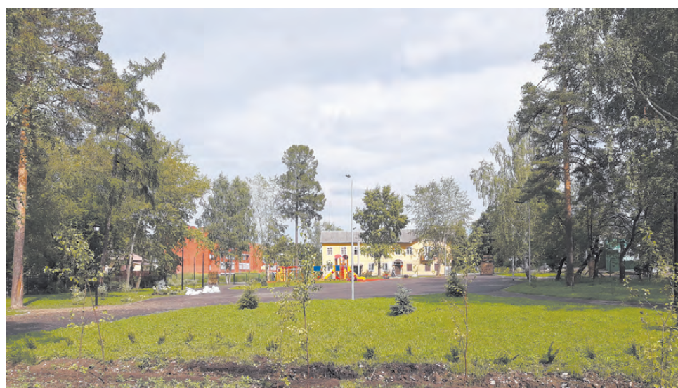
На территории парка организованы новые дорожки, клумбы и детская площадка.