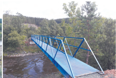
Новая переправа красива и надёжна.