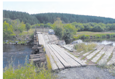
Старый мост стал опасен для передвижения.