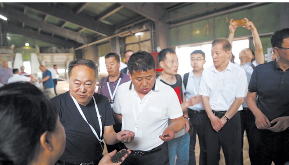
Китайские специалисты заинтересованно изучают качество торфа.