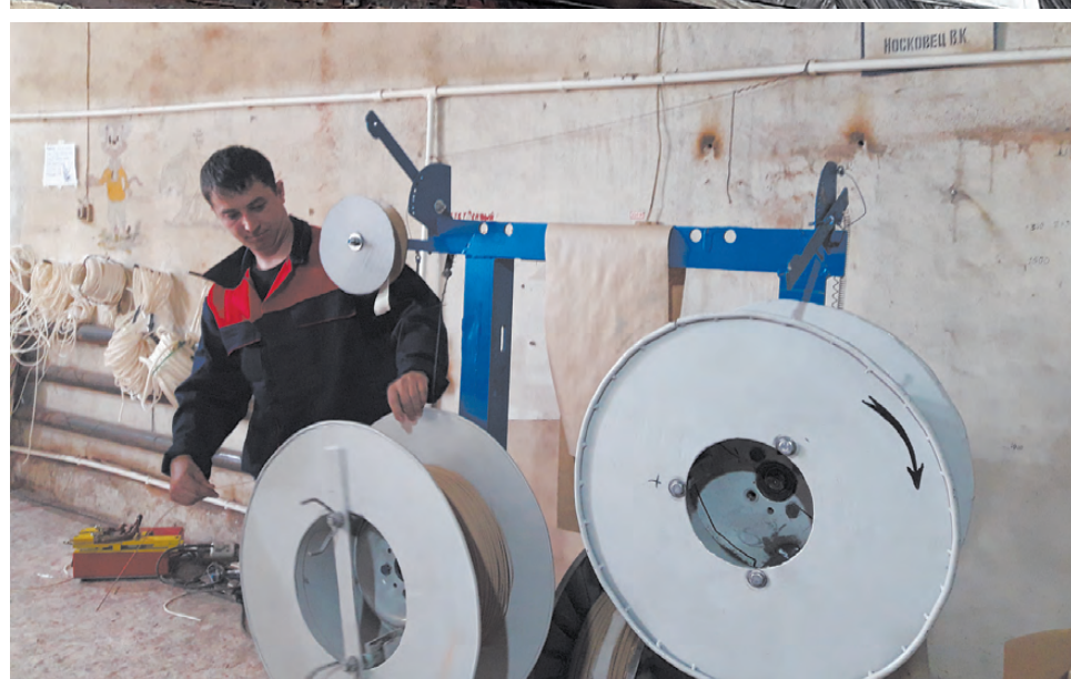
ООО «Завод «Трансформатор-Реж» функционирует стабильно, обеспечивая работой и достойной зарплатой своих специалистов.