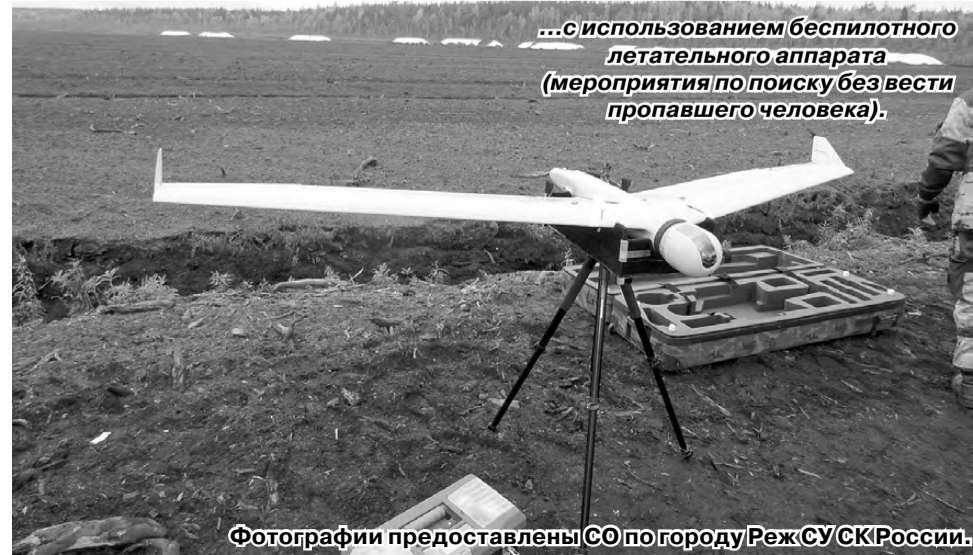
...с использованием беспилотного летательного аппарата (мероприятия по поиску без вести пропавшего человека).