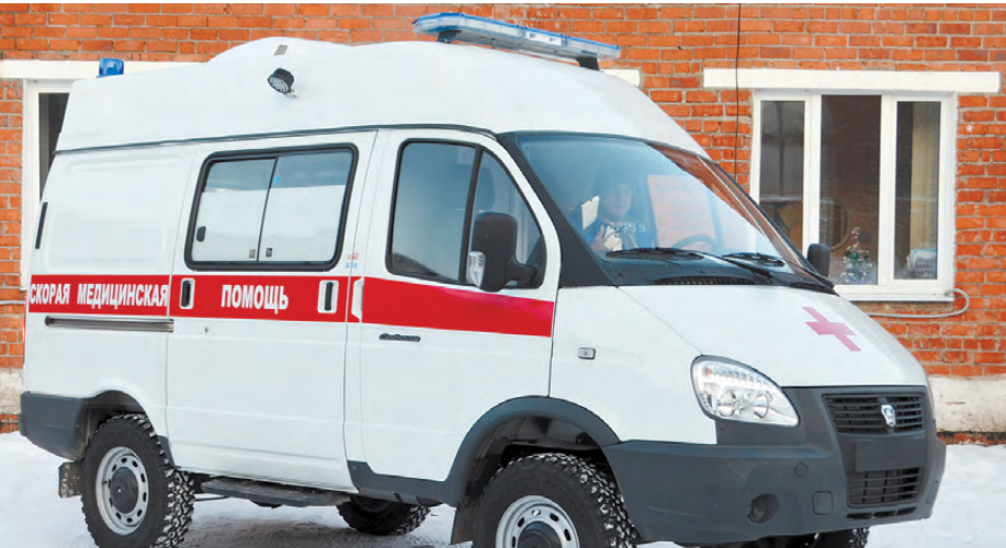
Новый автомобиль стал замечательным подарком Режевской ЦРБ к Новому году.