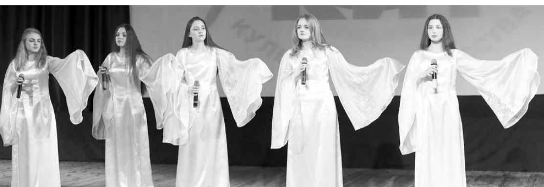
Вокальная группа «Созвездие».