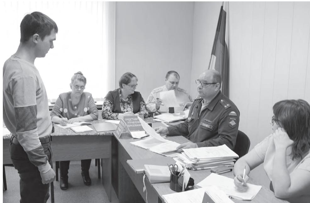
На призывную комиссию приглашают молодых людей 1998-1999 годов рождения.

Весенний призыв начался неделю назад – 1 апреля. А завершится он, как обычно, 1 июля. Несмотря на то что призывная кампания только началась, уже можно подвести первые итоги. Молодые люди активно приходят в военный комиссариат, и среди них немало желающих отправиться на военную службу.