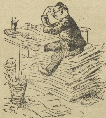
Ума не приложу — как бы улучшить производство. Рис. В. Баркова и В. Лисевича.

Причина этого состоит в том, что администрация рудника не обеспечивает нас крепезным лесом. Именно поэтому с 1 по 12