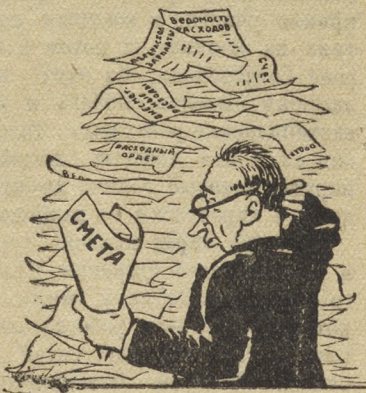
— Не уложиться! Рис. В. Баркова и В. Лисевича.