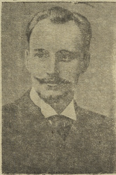
Н. С. Бауман.

Бауман стоял твердо на позиции Ленина и после раскола партии на большевиков и меньшевиков ринулся в бой против меньшевиков.