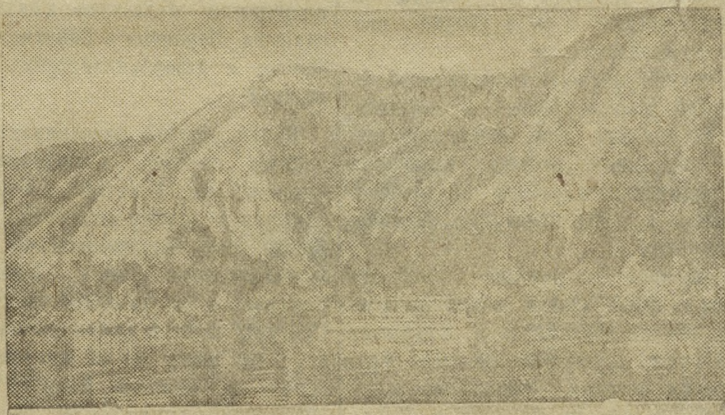
Жигулевские горы в районе строительства Куйбышевского гидроузла.

зная все эти безобразия, мер к ликвидации их не принимает. М. П.