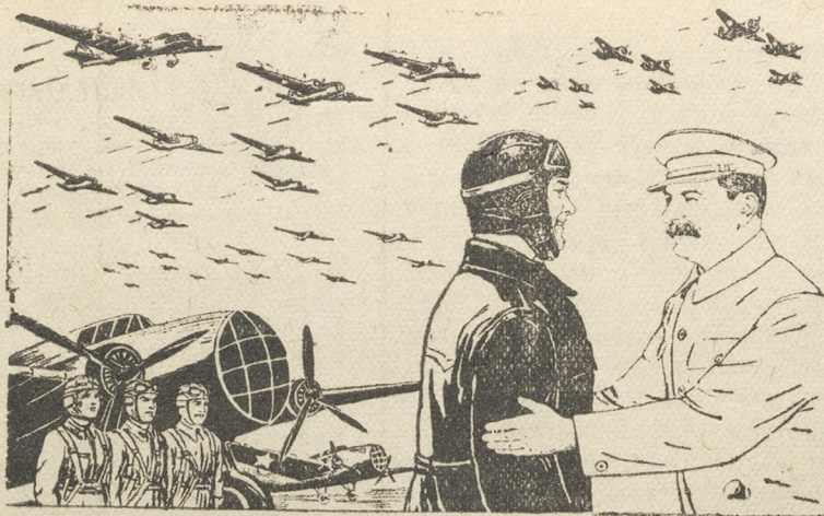
Рисунок В. Баркова и В. Лисевича.

Могучи крылья советского народа. Слава сталинской авиации гремит на весь мир. Ее поднимают все выше тысячи наших славных летчиков. Ознаменуем же День авиации новыми трудовыми подвигами, с еще большей энергией будем множить и совершенствовать наш воздушный флот!