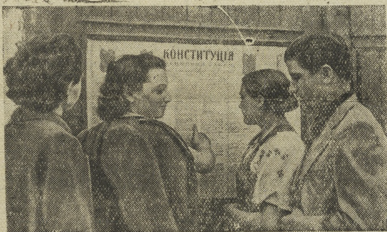
Жители г. Кишинева читают Сталинскую Конституцию.