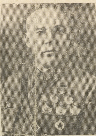
Народный Комиссар Обороны СССР, Маршал Советского Союза, Герой Советского Союза С. К. Тимошенко.

XXI годовщина освобождения Урала от Колчака. (Докл. тов. Алексеенков). Вход свободный.