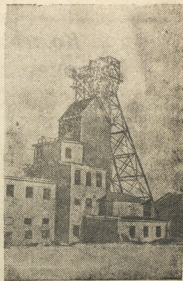
Новая шахта № 1-бис треста Карагандауголь, построенная за один год и полностью механизированная.