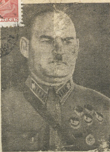
На снимке: Маршал Советского Союза, заместитель Народного Комиссара Обороны СССР ГРИГОРИЙ ИВАНОВИЧ КУЛИК.