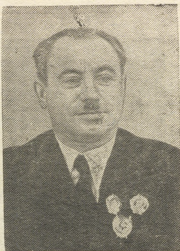
Тов. И. Д. Папанин.