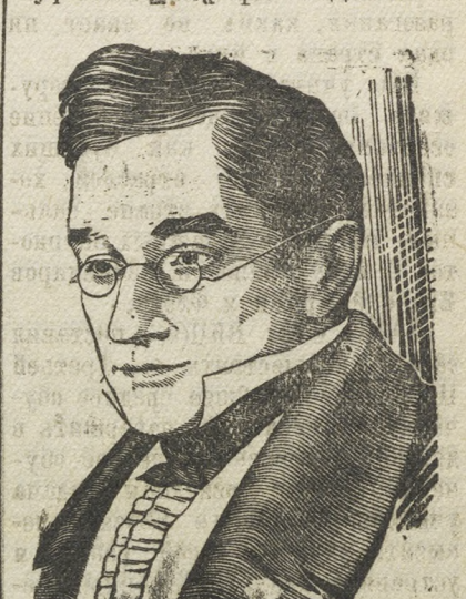
А. С. Грибоедов. Рисунок К. Теодоровича.

145-лет со дня рождения (15 января 1795 г.) знаменитого русского драматурга А. С. Грибоедова.