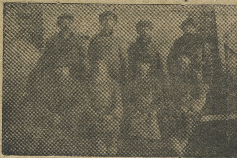
Ударная бригада плотников (старичков) на постройке криолитового завода систематически перевыполняет производственную программу.