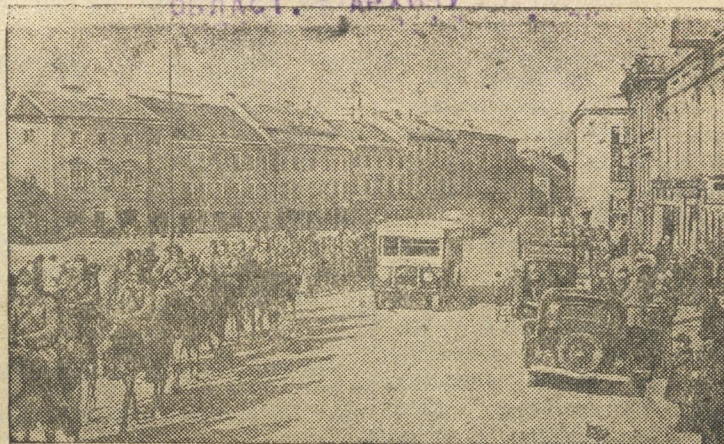
На снимке: Части Красной Армии на улицах города Вильно.

СВЕРДЛОВСК, УЛ. ЛЕНИНА, 32 РАЙОСТ. АРХИВУ