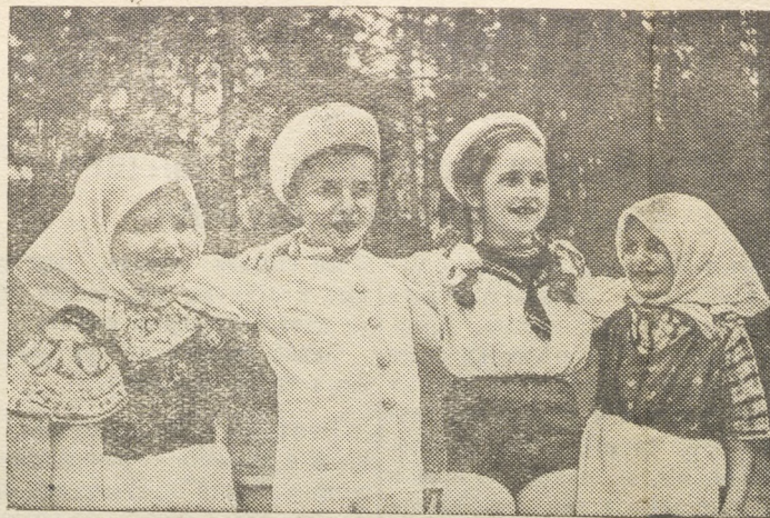
На снимке: В детском саду полусанаторного типа Народного Комиссариата общего машиностроения (станция Ильинское, Ленинской железной дороги).