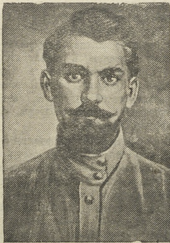
Н. А. ЩОРС.

После первых же боев с оккупантами Щорс понял, что решительную победу можно обеспечить лишь в том случае, если мелкие, разрозненные партизанские отряды будут объединены под общим командованием и