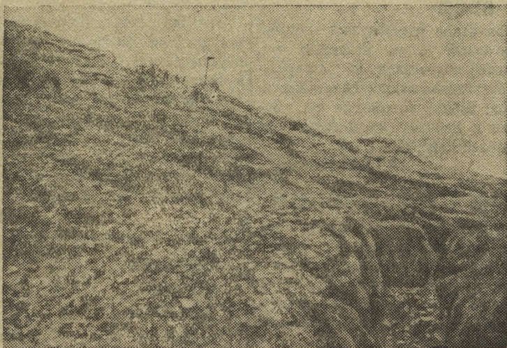
На снимке: Передний скат — место боев с японцами.